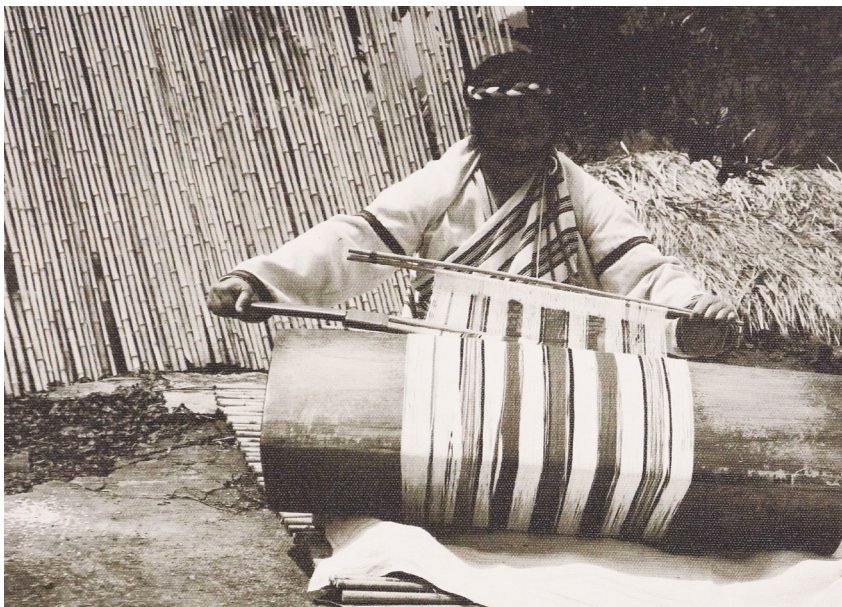
圖 1：gaya 對於男女的分工十分明確：男人負責授獵，女人則負責耕種與織布。