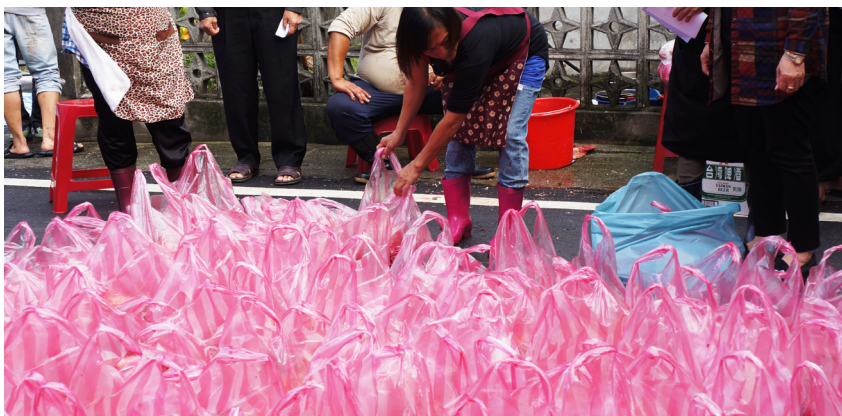
圖 1：婚宴主人以唱名方式將豬肉分贈給現場親友。

除了分享豬肉之外，還有一件重要的事，那便是喝到豬血湯。豬隻宰殺之後，所剩下的內臟、豬血，會加上米粒一起熬煮一大鍋，煮成豬血湯的讓現場親友享用，「每個人都一定要喝上這碗豬血湯，才算有參與到當天活動的意思。」大伙兒在同一空間享用熱湯、一塊同樂，這種參與的分享可絕對不能少啊！