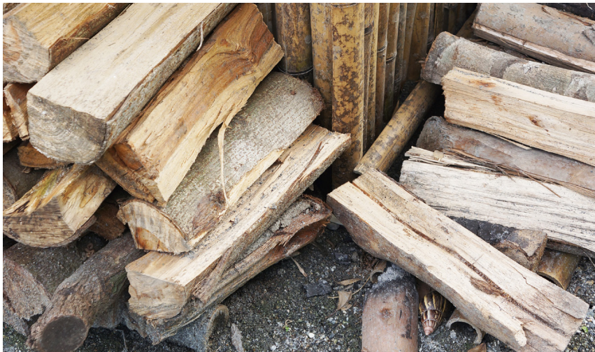
圖 2：gaya 就連要使用哪種木頭來生火這件事，都有明確的規範。