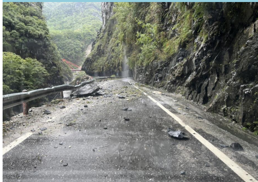
邊坡雨瀑、護欄扭曲變形及路面刮痕