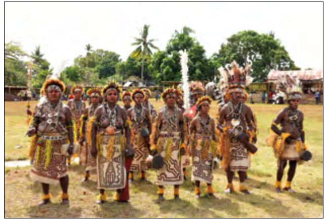
圖8 於慶典中以樹皮布盛裝打扮的巴布亞新幾內亞原住民