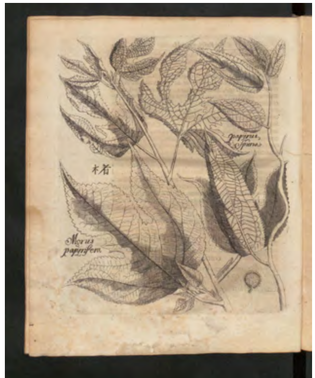
圖5《異域采風錄》中描繪構樹的圖板(作者: Engelbert Kaempfer 肯普費 /)

《植物種誌》( Species plantarum )中引用，成為構樹最早的合法學名 Morus papyrifera L.。18世紀末法國博物學者布松內(Pierre Broussonet)在訪問蘇格蘭期間將一株構樹枝條帶回巴黎博物館栽種，但該枝條順利長大後卻開出了球形的雌花序並結出紅色果實，與桑屬植物截然不同，顯示構樹並非桑屬植物，於是，以提出用進廢退論而聞名的法國生物學家拉馬克(Lamarck; Lam.)於1789年為構樹立了新屬 Papyrius Lam.; 於此同時，另一位法國學者萊里捷-德布呂泰勒(Charles Louis L'Héritier de Brutelle; L'Hér.)提出以 Broussonetia 替構樹屬命名用以紀念布松內，其提議也廣受當時學者認同。不幸的是，此時正值法國大革命之際，萊里來不及將該學名正式發表即在1800年被暗殺身亡。所幸萊里的提議為另一名法國植物學家馮特納(Etienne Ventenat; Vent.)採用，並於1799年在其