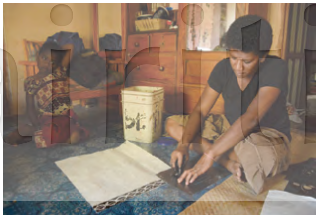
圖10 斐濟人慣以模板印花的方式裝飾樹皮布