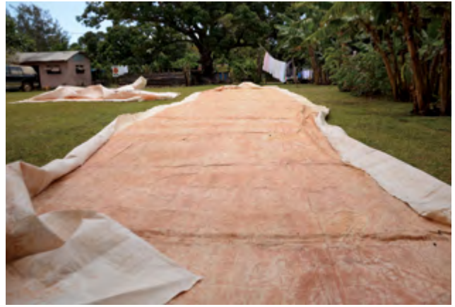
圖13 東加地區製作的大件樹皮布

成功的「地景轉移」(transported landscape)是南島語族能拓殖遠大洋洲島嶼的關鍵。太平洋地區約有70種與南島先民的生存與文化傳承產生緊密的共生物種是藉由南島語族的遷徙而傳播過去的，所以研究這些物種的族群遺傳結構，便能夠推論攜帶他們的南島語族人當初是如何活動的。過去20年間，南島「共生物種」如豬、雞、狗等動物，以及麵包樹、香蕉、芋頭、椰子、番薯等的親緣地理研究，揭開了南島語族拓殖與往返島嶼間的複雜歷史，有時能清楚的支持某個論點，有時卻更加點出了南島語族遷徙這個議題的盤根錯節。