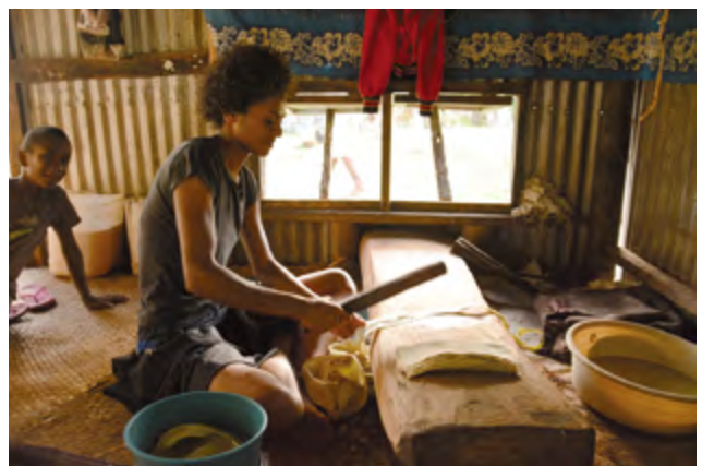
圖9 斐濟當地的島民以木製打棒捶打構樹皮製作樹皮布

南島語系包含了三億八千多萬人使用的1,200種語言，是世界上分佈最廣、多樣性最高的語系，南島語族先民拓殖遠大洋洲島嶼的歷史一直是人類學研究的重要議題，他們在太平洋上的遷徙，是人類歷史上最後一波大規模的移民，這些人是從何而