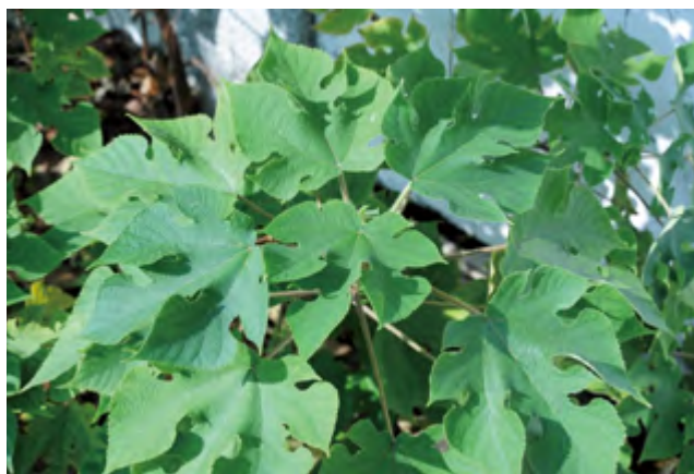
圖1 構樹葉

構樹，學名 Broussonetia papyrifera (L.) L'Hér. ex Vent.，是桑科 (Moraceae)、構樹屬 ( Broussonetia L'Hér. ex Vent.) 的植物，廣泛分佈於臺灣、中國黃