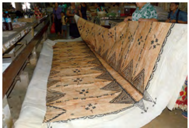
圖14 在東加的市集中亦有販賣樹皮布

2008年時任教於國立臺灣大學森林環境暨資源學系的鍾國芳受到國立臺灣史前文化博物館南島文化