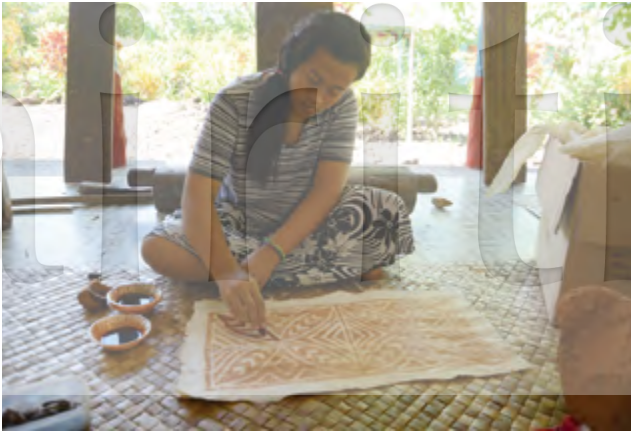
圖12 薩摩亞當地居民彩繪樹皮布