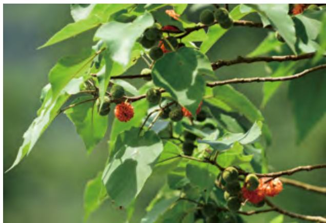
圖2 果實成熟後為鮮紅色

河流域以南到中南半島。光聽到構樹這個名字，一般人不見得認得，但在認識其外形特徵後，會赫然發現構樹竟是在臺灣路邊隨處可見的雜木，常為荒廢空地或次生林地中的優勢種，恣意生長，甚至在城市的各個牆隅路旁都可輕易見證它的無所不在。構樹的葉子其實十分特別，極好辨識，雖然也有不同的形態，但在臺灣常見到的為3至5瓣的掌狀裂 (圖1)，葉面上有許多絨毛，質感粗糙，另外也有卵狀的葉型，以及許多介於中間的形態。初夏時，構樹的多花果成熟時轉為鮮豔的橘紅色 (圖2)，果實柔軟多汁，常吸引鳥類及小動物來覓食，也可製成果醬食用。