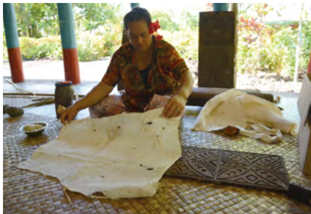
圖11 薩摩亞地區主要以拓印的方式為樹皮布添加飾紋

住、行、育、樂等需求,以及自身文明、文化的發展,與所利用的「動、植物」產生緊密的「共生」關係,同時也無意間改變了這些「共生物種」的自然地理分布和遺傳結構。