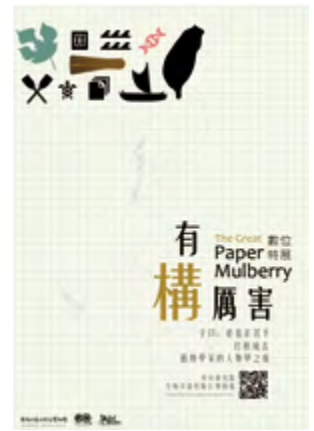
圖 17 生物多樣性數位博物館有構厲害系列特展

十年的辰光、無數研究人員的投入及更多旁人無私的援手, 最終歸結於一篇論文的出版, 僅僅數頁的篇幅, 該說是濃縮抑或稀釋了。2018年, 我們與中研院數位文化中心合作, 建立生物多樣性數位博物館( http://brmas.openmuseum.tw/ ), 嘗試將科學研究以另一種方式呈現, 藉由創新的媒介與多元內容, 讓民眾得以從不同角度接觸艱深的研究主題, 在專業中尋得與生活、文化與歷史的連接, 了解研究之於學術以外的價值, 更希望能將生物多樣性研究的成果及意義真正落實於社會中。首期數位特展便是以「有『構』厲害」為主題(圖17), 透過「子曰: 必也正名乎。」、「打樹成衣」及「植物學家的人類學之旅」三個子單元, 從臺灣最常見的植物—構樹, 乃至南島文化這份臺灣給世界的禮物, 在科普知識的傳遞之餘, 讓深受漢文化影響的我們從而探求與思考臺灣為南島原鄉的意義。