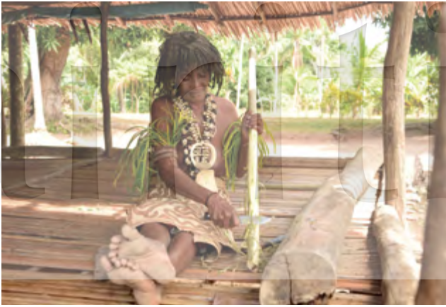
圖7 巴布亞新幾內亞原住民身著傳統服飾示範如何剝取構樹皮以製作樹皮布