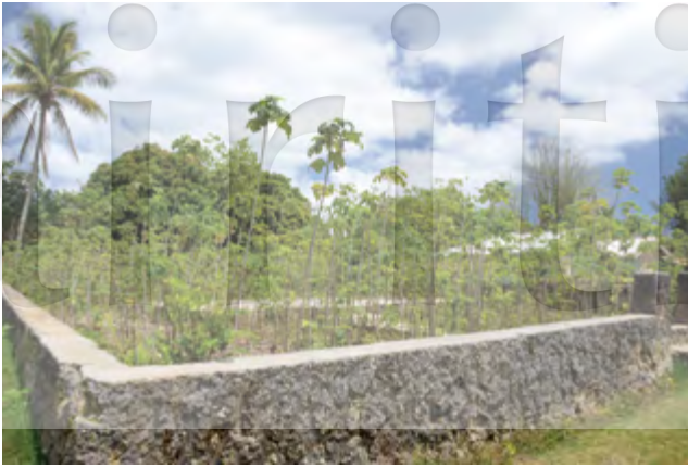
圖 16 東加島上栽植用於製作樹皮布的構樹

有可能是被帶出臺灣至當地的共生物種。此外, 構樹的生物學特性同樣也支持著此論點, 據文獻及在野外的觀察, 太平洋構樹全賴南島語族藉由根部萌櫟扦插無性繁殖(圖16), 而在經過可鑑識構樹性別的分子標記的分析後, 雌雄異株的構樹在太平洋幾乎皆為雌株。或許, 南島語族先祖攜帶構樹旅行時, 只帶了 cp-17 雌性植株, 之後藉由根部萌櫟無性繁殖的方式, 讓構樹生長、傳遍於一個又一個島嶼。種種證據皆顯示太平洋構樹的親緣地理與臺灣是南島語族原鄉的「出臺灣說」十分吻合。