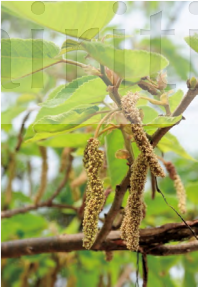
圖3 長穗狀的雄花序