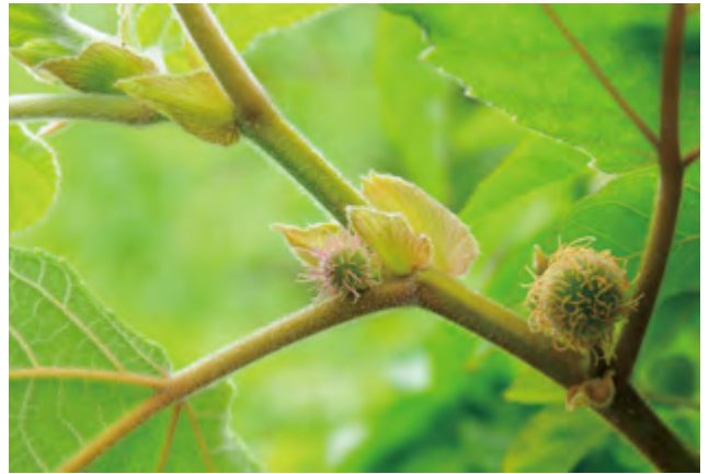
圖4 圓球狀的雌花序

《植物種誌》( Species plantarum )中引用，成為構樹最早的合法學名 Morus papyrifera L.。18世紀末法國博物學者布松內(Pierre Broussonet)在訪問蘇格蘭期間將一株構樹枝條帶回巴黎博物館栽種，但該枝條順利長大後卻開出了球形的雌花序並結出紅色果實，與桑屬植物截然不同，顯示構樹並非桑屬植物，於是，以提出用進廢退論而聞名的法國生物學家拉馬克(Lamarck; Lam.)於1789年為構樹立了新屬 Papyrius Lam.; 於此同時，另一位法國學者萊里捷-德布呂泰勒(Charles Louis L'Héritier de Brutelle; L'Hér.)提出以 Broussonetia 替構樹屬命名用以紀念布松內，其提議也廣受當時學者認同。不幸的是，此時正值法國大革命之際，萊里來不及將該學名正式發表即在1800年被暗殺身亡。所幸萊里的提議為另一名法國植物學家馮特納(Etienne Ventenat; Vent.)採用，並於1799年在其