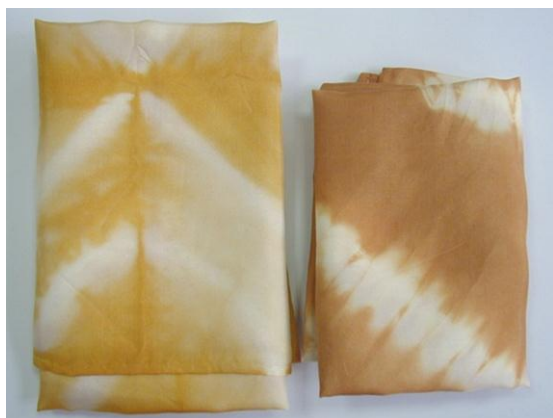
圖九：同樣用洋蔥皮染成的不同色調蠶絲巾

可和動物蛋白質分子如蠶絲，彼此產生吸引力而讓色素與纖維緊密結合。植物染的布料在使用一段時間後，色澤會更自然，尤其是一、兩年後，色澤最美（陳碧棠，2001）。