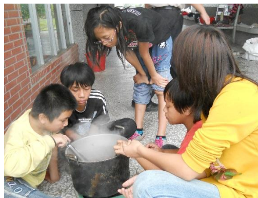
圖二：將綁好圖樣的棉麻布放在染料進行染煮（楊惠嫻提供）

為了傳承阿美族草木灰與植物染文化，帶著孩子跟著耆老上山砍柴。木柴完全陰乾後，經過祖靈託夢而選定地點，選擇乾燥晴天的日子染布（見圖一）。染布地點在溪岸或空曠地，先煮染材，利用不同溫度的水，將天然植物色素充分溶解，行程濃縮液，做成染料（見圖二）。將棉麻布綁成所要的圖樣。基本的準備工作完成，燒柴點火前，所有參與人員先一起祭祀祖靈，驅趕邪惡靈（阿美族語 mifetik），以保佑染布成功。但是前晚有做惡夢者、放屁、打嗝、打噴嚏者，不得參加。