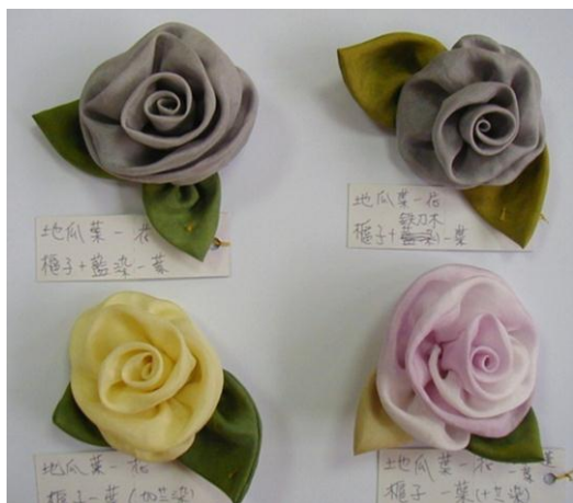
圖八：都是用蕃薯葉染成的不同顏色的蠶絲布花（傅麗玉攝，2001）

多種因素，而染成不同色調。南投中寮媽媽們染製的四朵玫瑰胸花都是用地瓜葉染絲布，卻出現不同的顏色（見圖八）。同樣用洋蔥皮染的兩條絲巾，卻出現不同的色調（見圖九）。這是因為染媒劑在布料纖維與色素之間扮演「聯繫者」的角色。染媒劑會與纖維產生鍵結，同時也與染料的色素產生鍵結，於是將纖維與色素兩者緊緊地結合，達到染色的效果。通常植物染的布料以天然纖維的染色效果最好，像棉、麻、蠶絲等，尤其是蠶絲的效果最好，棉的效果最差。因為植物製染料