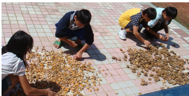
圖一：選擇乾燥晴天的日子染布，小朋友正在曬檳榔和薑黃染材

豐年祭期間走訪花蓮河東部落，連續好幾天都在秀姑巒溪河床，想親近瞭解河東部落特有的部落文化。看到雀、白鷺鷥、芒草、水芹菜、銀合歡樹、沙堆及大小石頭。此部落離秀姑巒溪河岸邊有幾百公尺，那外