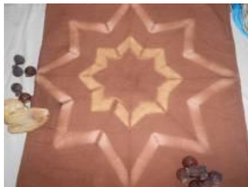
圖七：用熟曬的薑黃、檳榔萃取植物色素染出獨特的顏色