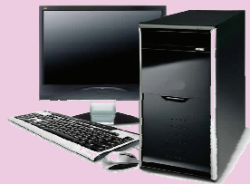
電 子 計 算 機