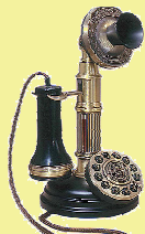
搖 臂 電 話