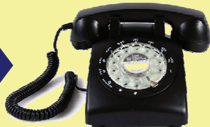
撥 盤 式 電 話