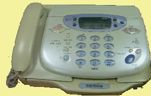
傳 真 電 話 機