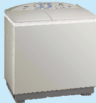
雙 槽 洗 衣 機