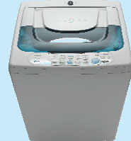
微 電 腦 洗 衣 機