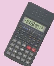
電 器 型 計 算 機