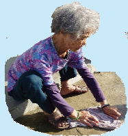
人 工 洗 衣

我 們 的 生 活 中 的 資 訊 科 技 是 不 斷 演 變 而 來 的 ， 例 如 ： 洗 衣 機 、 電 話 及 計 算 機 。