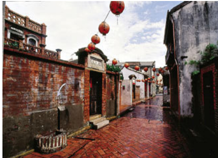
圖五 鹿港九曲巷一半邊井

十宜樓位在金盛巷內，又稱「跑馬廊」。十宜樓在早年，常有許多文人雅士聚集，在十宜樓上高談闊論、品茗對月，傳說十宜樓的主人位了使客人可以在高處賞月，因此在兩棟樓的中間建一座跑馬廊，十宜樓因為「琴、棋、詩、酒、畫、花、月、博、煙、茶」（註三）十宜以及和金盛巷交叉成十字，故名十宜樓，如圖五所示。