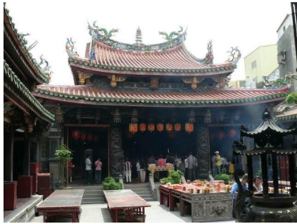
圖二 鹿港天后宮（親自拍攝）

龍山寺格局方正，山門爲三進兩廊九開間縱深式建築，入口的山門、五門殿、拜殿到後殿，是典型的三進二院的建築，前殿因爲有五扇門，因此又稱爲五門殿。石獅位於前殿入口的兩側，有鎮邪的作用，石獅位在台座上，彼此相望著對方，公獅常戲弄彩球也常撥弄雙錢，而母獅則是懷抱著小獅。而龍山寺正門如圖二所示。