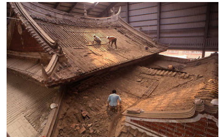
圖八 鹿港龍山寺修護

進行古蹟修復時，盡可能保留原構件，並用各種方法加以修理，不可以輕易抹去過去修補與歷史的部份，避免採用更新的手法，以保留更多的歷史訊息。