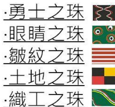
圖八 排灣族的文化特質