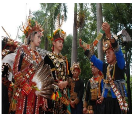
圖七 排灣族的文化特質