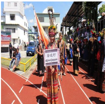
圖十、三地門鄉聯合豐年祭

安坡村的豐年祭可分二次。第一次在每年七月中進行，又稱村運；另一次約在每年八月中進行，稱鄉運。但又稱三地門鄉聯合豐年祭。因為傳統豐年祭常會帶著民俗技藝的呈現及比賽，所以每次都會加入許多的運動項目(田徑及球類運動)，並期盼族人的身心健康，養成強健的體魄。