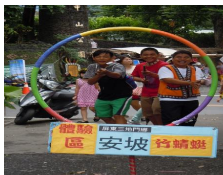
圖十三、童玩體驗活動