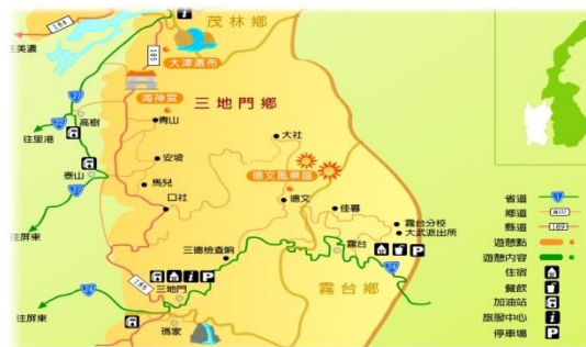
圖九、三地門地理位置