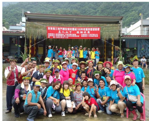
圖十一、安坡部落村運暨豐年祭