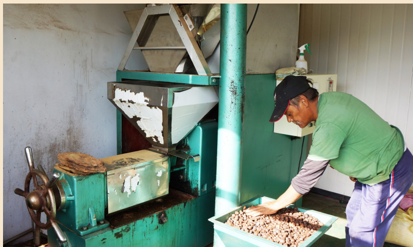
崙山自行榨製苦茶油，是部落重要的生財管道

直到近五年來，情況才逐漸出現轉變。崙山部落為找回過去榮景，復耕了 40 公頃的油茶樹，並且開始自己榨油，以自我品牌打響了「崙山苦茶油」的通路。崙山苦茶油在出道的第一年就賣得不差，去年更因黑心油風暴而知名度暴增，有錢都買不到，呈現完全的缺貨狀況。