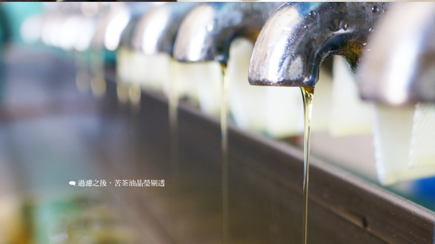
過濾之後，苦茶油晶瑩剔透