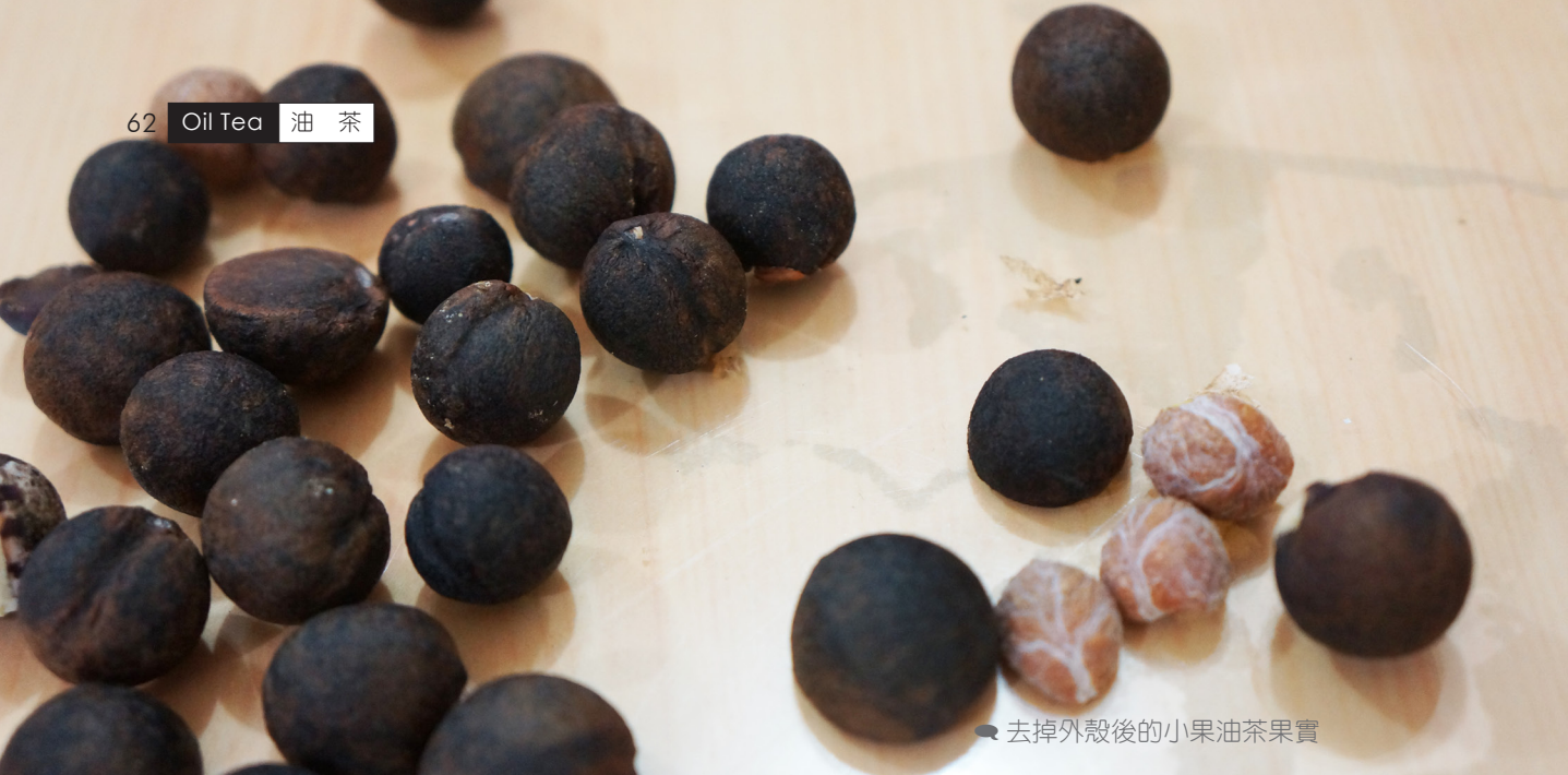
去掉外殼後的小果油茶果實