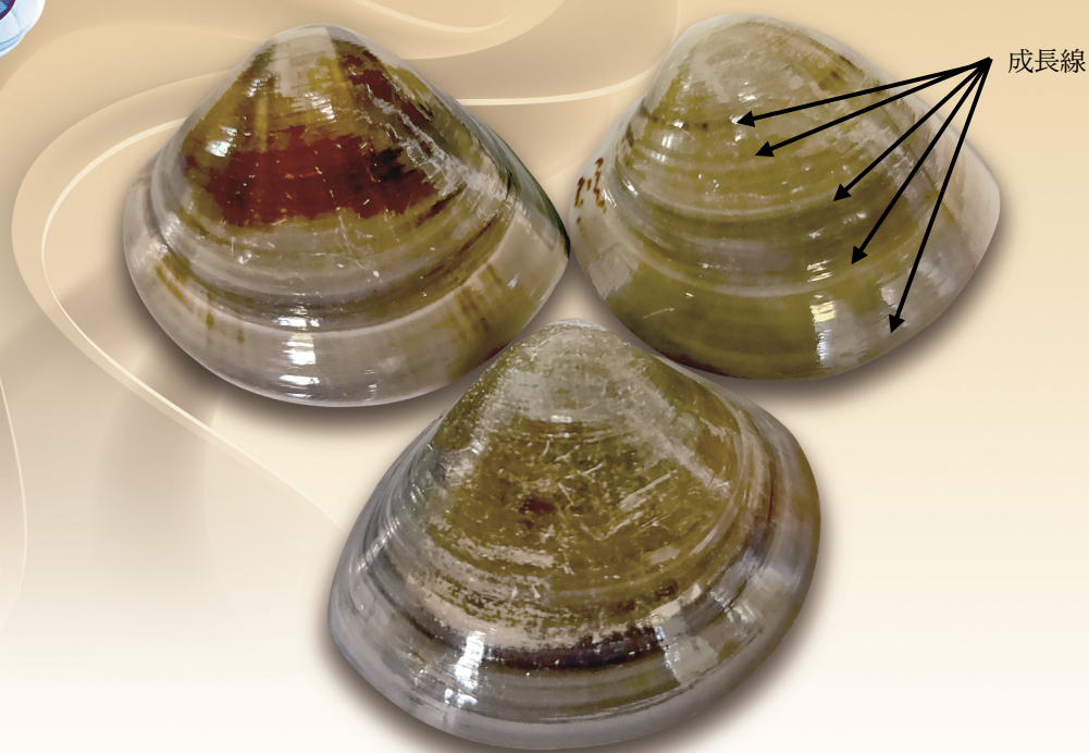
圖 1 文蛤殼的成長線