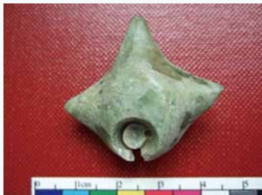
台東舊香蘭遺址出土的三突起玉玦耳飾，這顯然是一件未完成的玉器。