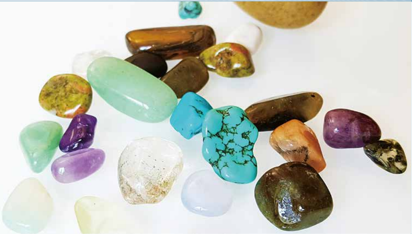
玉是一種礦物，如無人理它就只是石頭而已，它的生命力來自人類的使用。