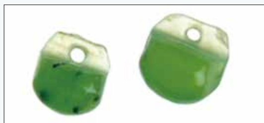
卑南遺址出土的鈴形玉珠，一顆幾乎一模一樣的玉珠也曾在呂宋島南部的 Kay Daing 遺址出現過。

史前人使用的台灣玉主要來自撿拾河中的籽料，供給有限，但是台灣玉玉器卻分布全台。運送流通需要跋山涉水及漂洋