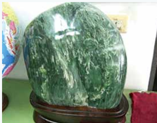
打磨拋光後的台灣玉

閃玉或稱為軟玉，屬於角閃石類礦物，主要由透閃石和陽起石所組成，呈纖維狀交織結構，非常堅韌，硬度約為 5.5～7 度。雖然稱為軟玉，但是有些軟玉的硬度比硬玉還高。台灣玉及和闐玉都屬於閃玉，只是新疆和闐出產的閃玉含鐵量很低，外觀純白有潤澤感，像是羔羊脂肪，因此又稱羊脂玉。而台灣出產的閃玉含鐵量較高，顏色在翠綠色到墨綠色之間。綠色閃玉的產地除了台灣之外，還包括環太平洋的紐西蘭、美國、加拿大、日本、韓國、俄羅斯等地。