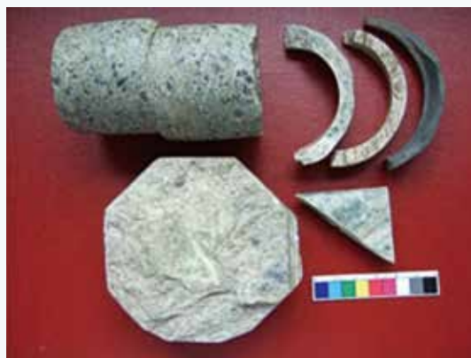
平林遺址出土的玉廢料

發展期—4,500 ~ 3,500 年前，這時期是新石器時代中期，出土玉器的遺址除了東部以外，已廣布至宜蘭、台北、台南等地，