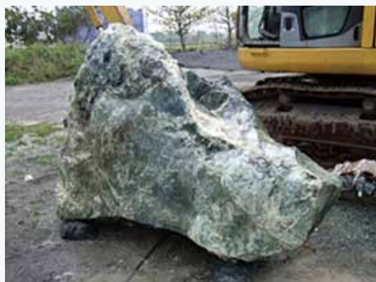
包含蛇紋岩及台灣玉的原石

台灣玉在台灣曾風光一時，從 1965 年之後的十餘年，被大量開採及加工，賺進不少外匯，但曾幾何時，風光不再。一窩蜂的濫炸開採使得成材率低，品質下降，加上開採成本增加及不當的銷售手法，使得台灣玉的市場競爭力大跌。而同是綠色閃玉的加拿大玉外觀與台灣玉十分相似，品質也不差，因此趁勢而起，進口取代了開採。