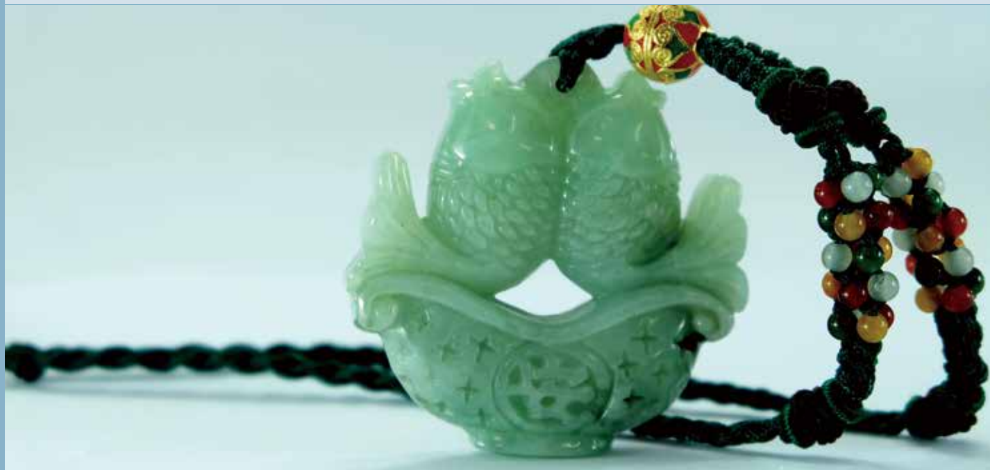
玉石從古至今被人們喜愛及運用

除了玉器之外，卑南遺址也出土玉器廢料，代表有部分玉器是在當地製造的，或可進一步推測卑南文化人也有製作玉器的技術。但是廢料的數量不多，與大量的玉器不成比例，也就是說，大多數的玉器仍是由外地貿易輸入而不是當地製作的。