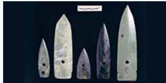
卑南遺址出土的玉矛頭及玉鏃

拾、製作、運送到最後交到卑南文化人手中，中間涉及的資源控制及交換的情形如何？史前玉器在興盛時期全台都有，但為何卑南文化人的玉器消費遠高於其他地區，而且歷經千年不墜？製作一件玉器相當費時費工，玉器得來不易，玉材產地居民及玉器工匠們為什麼願意長年維持與卑南文化人交易？卑南文化消逝的年代與玉器沒落的年代相近，這是巧合還是背後有什麼未知的故事？