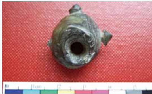
台東舊香蘭遺址出土的三突起玉玦耳飾，這一類型的玉器在台灣很少，在 2,500 ~ 2,100 年前的東南亞卻十分流行，使用的是台灣玉。

台灣玉在東南亞環南海地區廣泛分布的情形，說明了海洋對史前人來說不是阻隔而是道路，他們在環南海地區早就行動自如了，台灣玉在南海地區的貿易交流上扮演了重要的角色。不過，史前人在南海的貿易交流仍是有選擇性的，像是地理上離台灣較近的越南北部反而看不到台灣玉，而一些出現台灣玉的遺址卻和南島語族的分布有高度的相似性，這似乎暗示台灣玉在東南亞的分布很可能和古南島語族的擴散或交流有關。