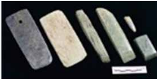
卑南遺址出土的玉鏃、玉鏃。