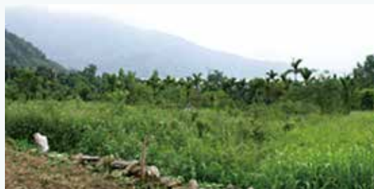
平林遺址，遠方的山就是台灣玉礦區的老腦山。

甚至在澎湖也有出現。製作的器物以鏃、鏃、鏃等工具為主，但也有手環、耳環、墜飾等裝飾品出現。台灣玉製作的玉器較前期多，製作技術增加了鑽穿及圓形切割的技術。