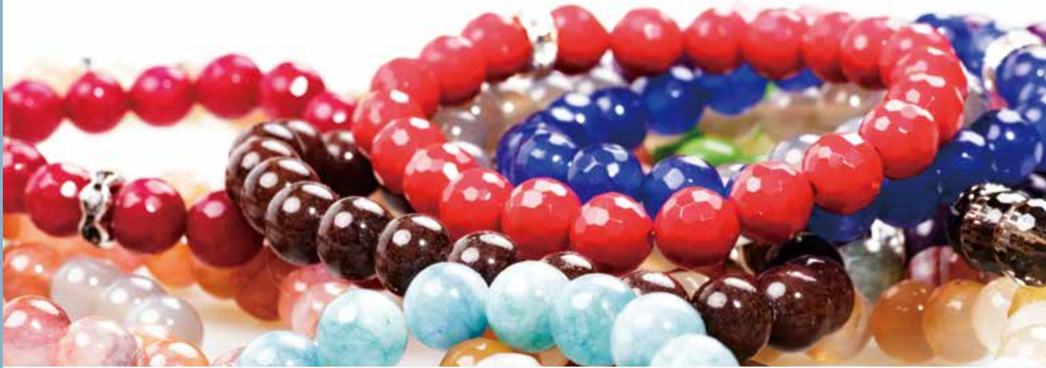
台灣玉器的衰退，可能是因為玉飾品被玻璃及瑪瑙取代。

這類方塊玉料可能是台灣的玉匠帶出島外的胚料，然後在海外連工帶料地完成當地指定製作的玉器。