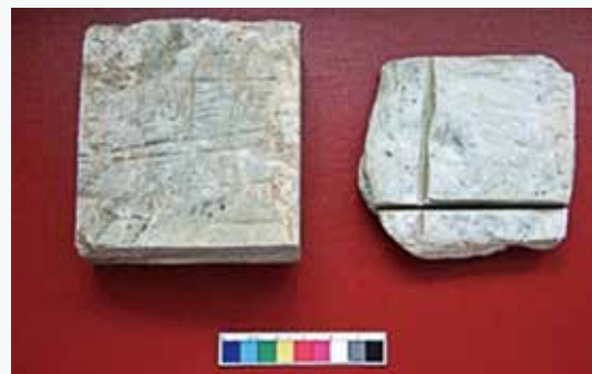
平林遺址出土的方塊玉料，類似的方塊玉料在越南南部及泰國南部的遺址也有發現，可能是台灣玉匠帶出去的。

第二波約距今2,500～2,100年前，東南亞地區已進入鐵器時代，也是台灣玉器由盛轉衰的年代。這時台灣玉的輸出改為玉材輸出，在綠島、蘭嶼、菲律賓北部、