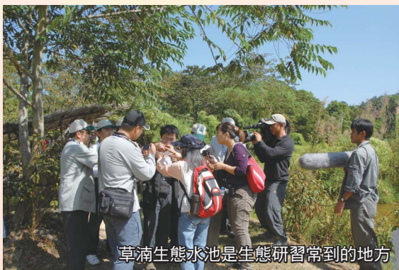
草湍生態水池是生態研習常到的地方