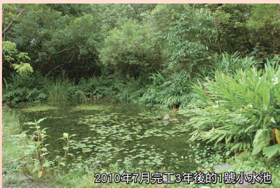
2010年7月完工3年後的1號小水池