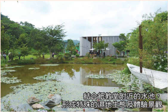
結合紙教堂附近的水池， 形成特殊的濕地生態及體驗景觀