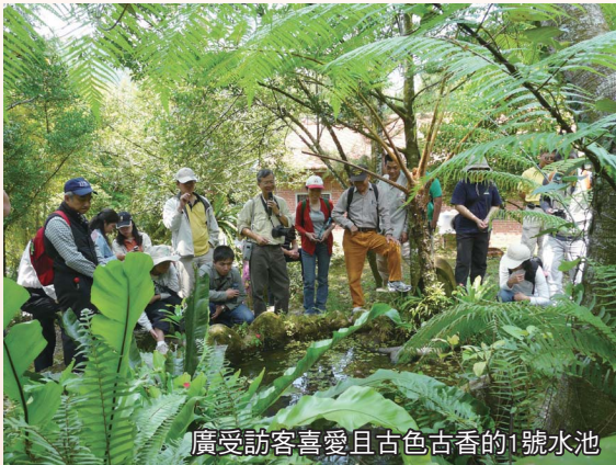
廣受訪客喜愛且古色古香的1號水池