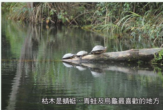
枯木是蜻蜓、青蛙及烏龜最喜歡的地方