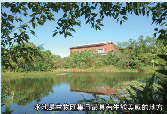
水池是生物匯集且最具有生態美感的地方

水域環境是野生物匯集交流最豐富的地方，不論哺乳類、鳥類、兩棲類、爬蟲類、昆蟲、魚蝦及各種水生植物，都會受到水的滋潤而大量繁殖聚集。社區內的農場、民宿、餐廳、住宅、公園、校園或公私機構之庭園，如能利用適當之空地與水源營造生態化水池，不僅具有景觀、休憩、教育功能，更可為日漸都市化的環境增添一些適合動植物生長之生態空間，對活化社區生機及生物多樣性保育具有重大而直接的貢獻。很可惜的，目前我們所看到分布在各地的大小水池，幾乎都太人工化，池底、池岸都是水泥或塑膠布，水岸都是垂直或水泥化，形狀都是平整之四方形或圓形，加上缺少動植物生存所需之多孔隙空間、平緩池岸與水生植物，所以容易變成死亡或沒有生命的水池，生態價值不高。