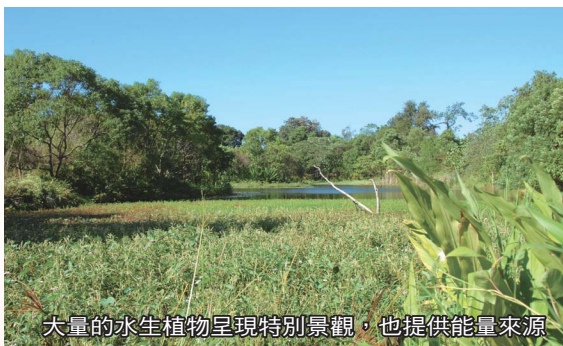
大量的水生植物呈現特別景觀，也提供能量來源