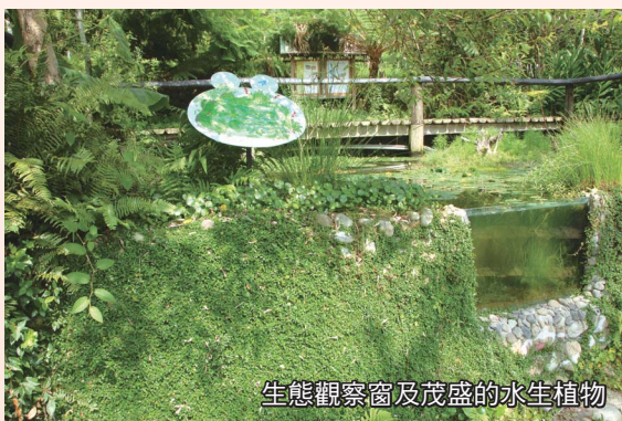
生態觀察窗及茂盛的水生植物