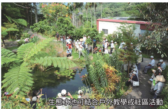
生態水池可結合戶外教學或社區活動