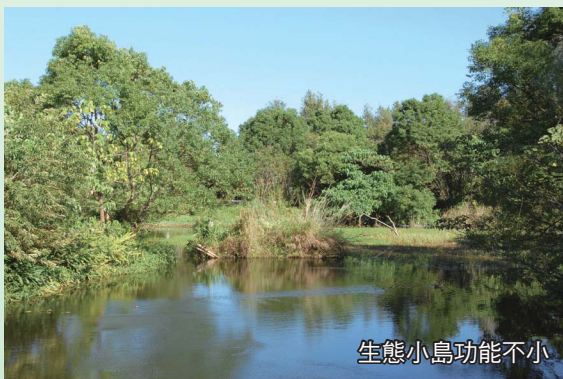
生態小島功能不小

池中儘量設計2~3個緩坡且彎曲的生態小島，並混合密植多樣化植物以提供各種生物安全而隱蔽之隔離空間。如果水池空間不夠大，亦可以植生竹筏取代生態小島。小島之沿岸長度如果有20公尺以上，浮出水面1.5公尺高度，則具有不錯之效果。