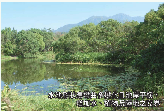
水池形狀應彎曲多變化且池岸平緩，增加水、植物及陸地之交界面

應求彎彎曲曲、多變化，以延伸池岸生態帶的長度，增加水、植物及陸地之交界面，不僅提高景觀美感，亦提供生物良好的隱蔽水岸；儘量避免平直、整齊之單調形狀。