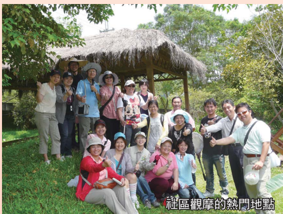
社區觀摩的熱門地點