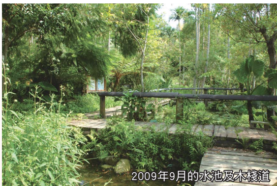
2009年9月的水池及木棧道