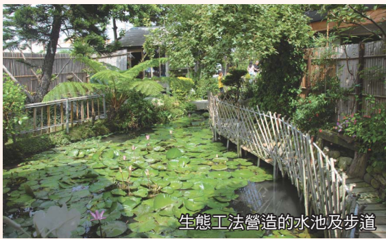
生態工法營造的水池及步道