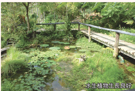
水生植物生長良好