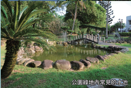
公園綠地內常見的水池