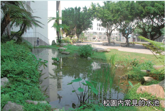
校園內常見的水池

近年來作者在921地震後的重建社區進行長期的生態社區營造輔導工作，更深刻體認，一個好的生態水池可以為社區的物種保育、氣候調節、環境教育及生態旅遊做出很大的貢獻。特別是在埔里鎮的桃米社區，生態水池幾乎是每家民宿的基本設施，訪客們除了享受桃米的好山好水與幽靜環境外，在生態水池旁更可以觀察到蜻蛉、蝴蝶、螢火蟲的情影，並享受青蛙悅耳的鳴聲；而位在集集鎮的特有生物研究保育中心生態教育園區，更以擁有最美、最生態的生態水池而廣受各界肯定。為配合全世界生物多樣性保育之潮流，也為了創造更多對野生動植物友善而且適合它們生活與生存的水池，提昇社區之生機與生態品質，提供更多具有自然美與生態教育功能的社區景觀，謹就社區生態水池之規劃設計、植栽、利用管理及參考案例等予以簡要介紹，供各界參考。