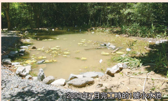
2007年7月完工時的1號小水池