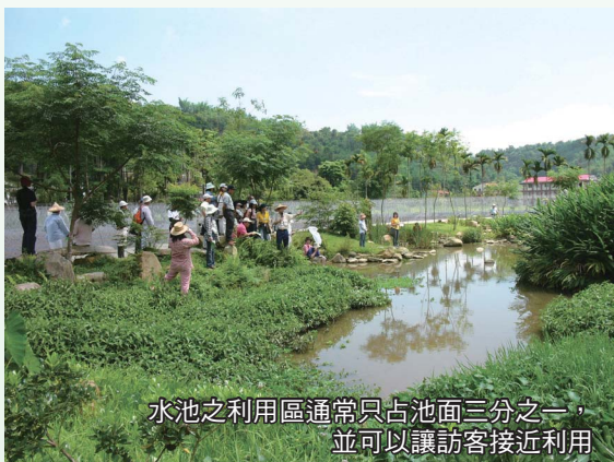
水池之利用區通常只占池面三分之一，並可以讓訪客接近利用

應將水池區分為利用區及保護區，並於保護區內禁止人為干擾或進入，才可能讓各種野生動植物有適當之生長及隱蔽處所，保護區面積應占水池三分之二以上。即使親水利用，亦應考慮到最大承載量之問題，否則生態水池可能因利用過度，毀於一旦。通道應在水池邊緣通過，切忌由中間切斷池面。另外，在使用上應有明確之利用目標及規劃並經常使用，例如教學、生態觀察、休憩、展示、物種蒐集、保存、寫生或生態攝影比賽等，利用區可以設置步道、涼亭、坐椅、平台、公共藝術、解說牌、拱橋等適當設施，方便居民及訪客親近使用，否則很容易變成使用率偏低的奢侈品或荒廢池。