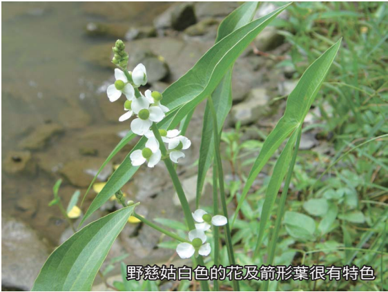
野慈姑白色的花及箭形葉很有特色