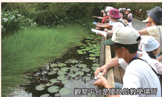
觀察平台是優良的教學場所