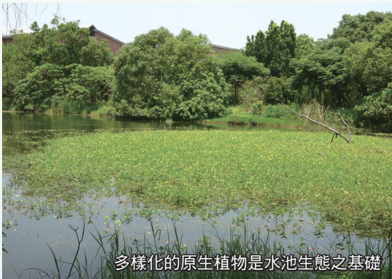
多樣化的原生植物是水池生態之基礎

依不同水深，栽植原生之濕生、挺水、沉水、浮水及浮葉等植物，周邊栽種親水之原生地被、灌木及喬木，並應使植物、枯枝落葉和水體有最多的接觸面及適當的遮蔽。多樣化的原生植物是水池食物網、動物避敵與活動、戶外生態教學之基礎。