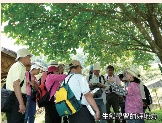
生態學習的好地方