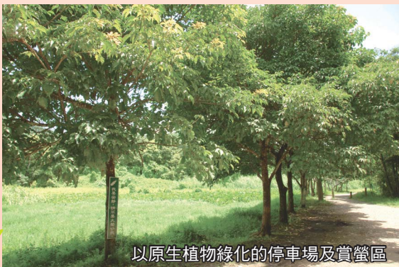
以原生植物綠化的停車場及賞螢區