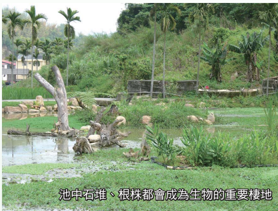
池中石堆、根株都會成為生物的重要棲地

可放置枯木、枯竹、根株、石堆，並使部分沉入水中，部分設置為直立之棲木，部分自岸上自然倒入池中，便於水棲昆蟲及魚蝦生存，亦可形成水陸兩棲動物之天然通路及水鳥、蜻蜓、烏龜之駐足點或曬太陽的地方。