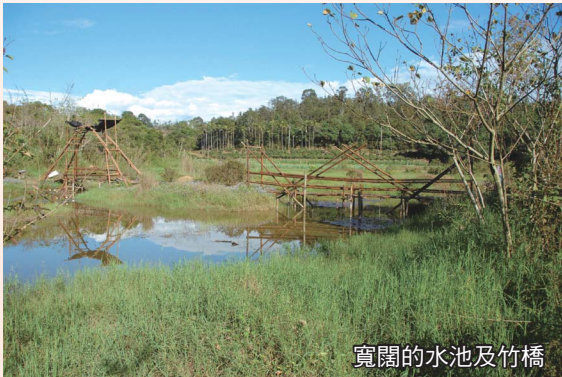
寬闊的水池及竹橋