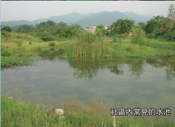
社區內常見的水池