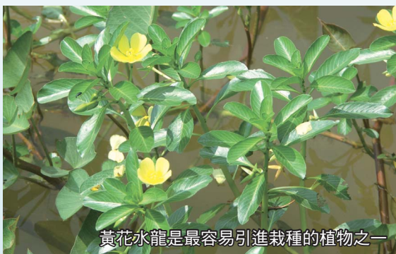
黃花水龍是最容易引進栽種的植物之一