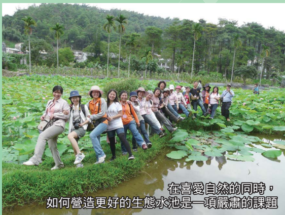
在喜愛自然的同時， 如何營造更好的生態水池是一項嚴肅的課題

由於自然生態系之複雜性及多樣性，所以每一個地方、工程地點或社區都有其特色及差異。實際進行生態水池之規劃設計時，要考慮當地特別的自然資源、環境特色及文化背景，並廣泛聽取及收集當地資訊後因地制宜，不能僵化於統一標準或原則。土地倫理及保育美學大師李奧波(Aldo Leopold)在他的代表性巨著「沙郡年記」中曾明白地告訴我們：「一件事情要是傾向於保存生物群落的整體性、穩定性及美便是對的。若它的傾向不是這樣，那麼它就是錯的(A thing is right when it tends to preserve the integrity, stability and beauty of the biotic community. It is wrong when it tends otherwise)」。在進行生態水池之規劃及營造實務時，應該要特別銘記在心。