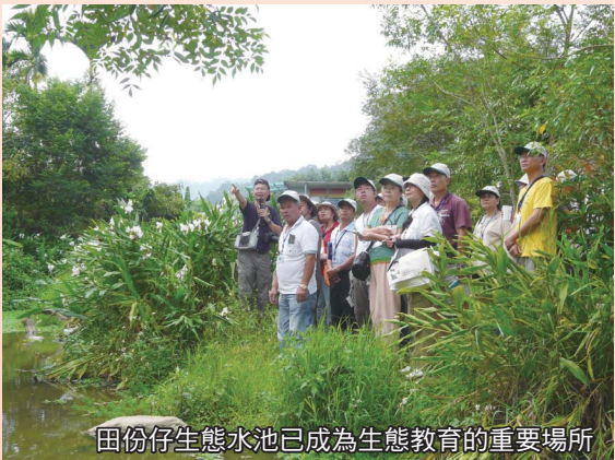
田份仔生態水池已成為生態教育的重要場所