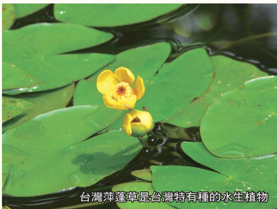
台灣萍蓬草是台灣特有種的水生植物

台灣萍蓬草、小蒼菜、印度蒼菜、龍骨瓣蒼菜、芡、白花水龍、台灣水薹、水馬齒、蓴菜、鬼菱、水禾、滿江紅、槐葉蘋、青萍、紫萍、水萍等。