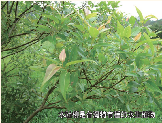
水社柳是台灣特有種的水生植物

水丁香、紫芋、蕺菜、三白草、木賊、大安水蓼衣、柳葉水蓼衣、披針葉水蓼衣、半邊蓮、田香草、白花紫蘇草、心葉母草、泥花草、陌上菜、田蔥、蔞菜、水竹葉、禺毛茛、大葉穀精草、日月潭蘭、大甲蘭、四角蘭、過溝菜蕨、黃花水龍、荷蓮豆草、過長沙、野薑花、鱧腸、水柳、水社柳、黃槿、穗花棋盤腳、稜果榕、水同木、雀榕、榕樹、苦楝、茄苳、九芎、筆筒樹、台灣杪欏、鬼杪欏、血桐等。