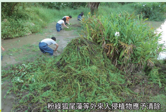
粉綠狐尾藻等外來入侵植物應予清除

水源及水量應設法使其清潔與穩定，池中及岸邊植物視其生長及競爭情形隨時做分次、分區整理，俾利維持多樣化之水池生態系。對於人厭槐葉蘋、大萍、小花蔓澤蘭、布袋蓮、白頭天胡荽、光葉水菊、李氏禾、粉綠狐尾藻、象草等入侵外來種應隨時予以清除。池面之植物覆蓋度保持在20~40%之間最為適宜，一方面可以提供水中生物充足之食物來源，一方面可維持較高之綠色景觀和野生動物之棲息、避敵場所。