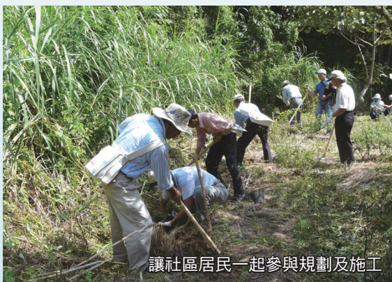
讓社區居民一起參與規劃及施工