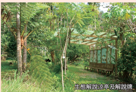
生態解說涼亭及解說牌