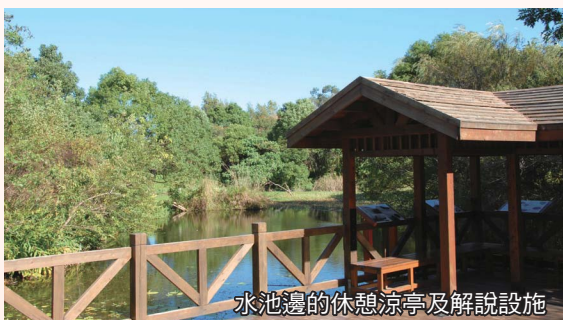
水池邊的休憩涼亭及解說設施