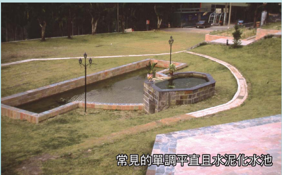
常見的單調平直且水泥化水池