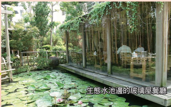
生態水池邊的玻璃屋餐廳