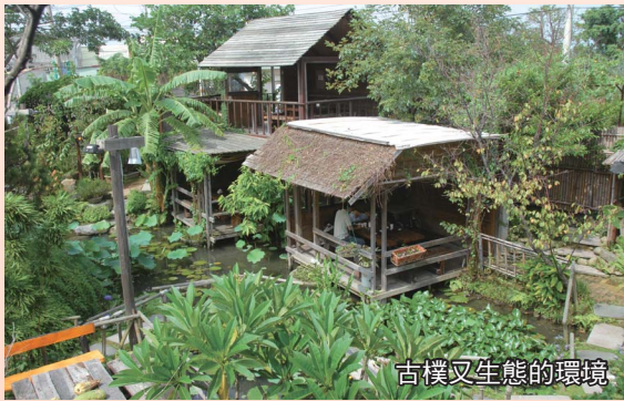
古樸又生態的環境