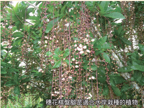
穗花棋盤腳是適合水岸栽種的植物