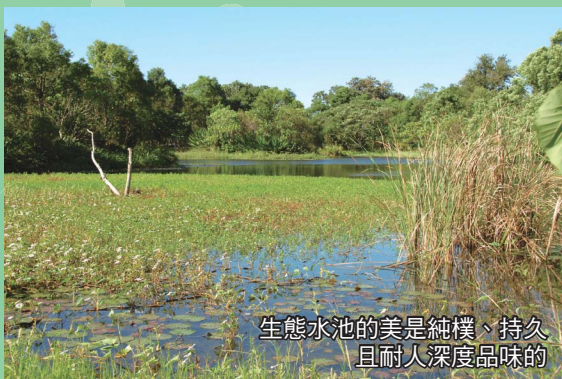
生態水池的美是純樸、持久 且耐人深度品味的