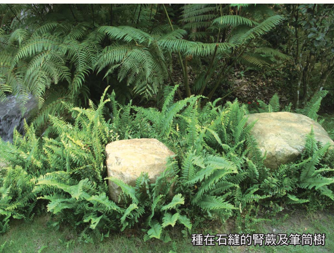
種在石縫的腎蕨及筆筒樹

雷公根、倒地蜈蚣、泥花草、心葉母草、 蔞菜、絡石、細梗絡石、武靴藤、革葉鋸齒紫 萁、木賊、過溝菜蕨、腎蕨、毛葉腎蕨、長 葉腎蕨、小毛蕨、星毛蕨、鐵線蕨、海金沙、 車前草、石菖蒲、越橘葉蔓榕、薜荔、珍珠蓮 等。