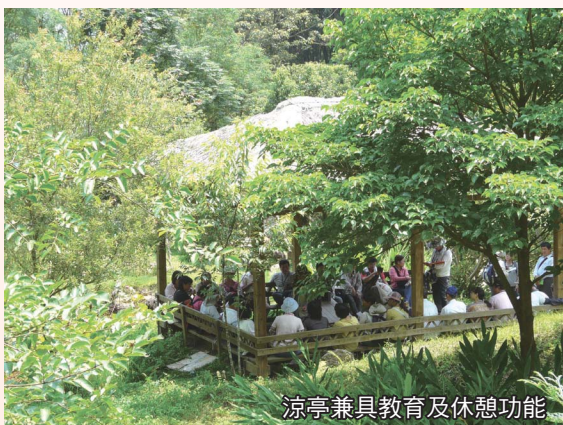
涼亭兼具教育及休憩功能