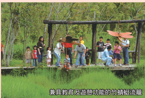
兼具教育及遊憩功能的竹蜻蜓流籠