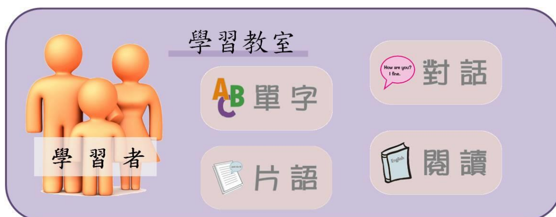
圖 3-2 學習教室功能圖