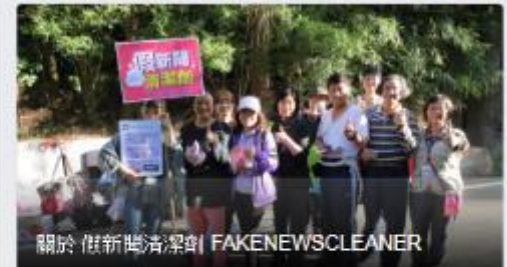
關於 假新聞清潔劑 FAKENEWSCLEANER