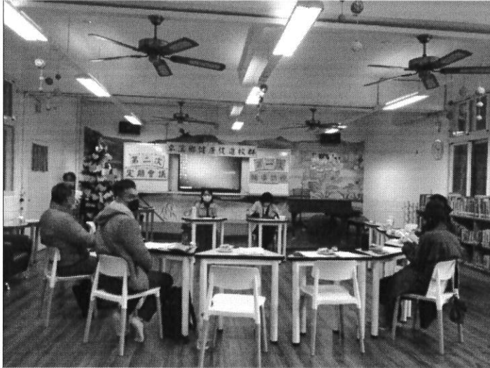
照片說明：卓溪鄉健康促進到校第二次輔導訪視