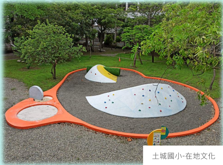
土城國小-在地文化