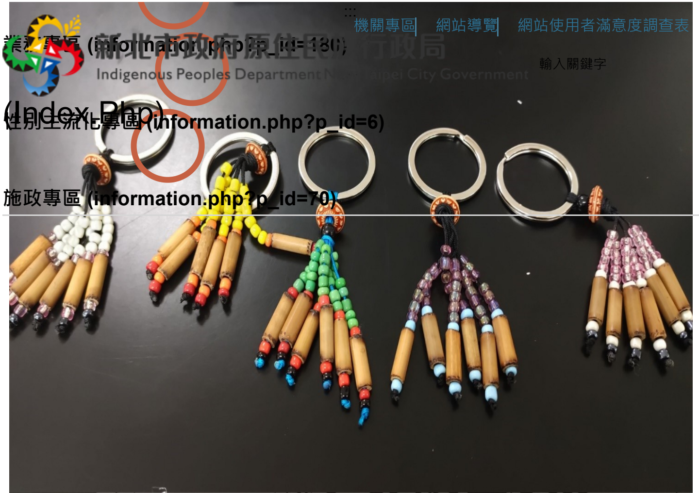
▲小朋友發揮個人創意，完成具泰雅文化特色鑰匙圈。

訊息公告 (information.php?p_id=175) 關於本局 (information.php?p_id=2)