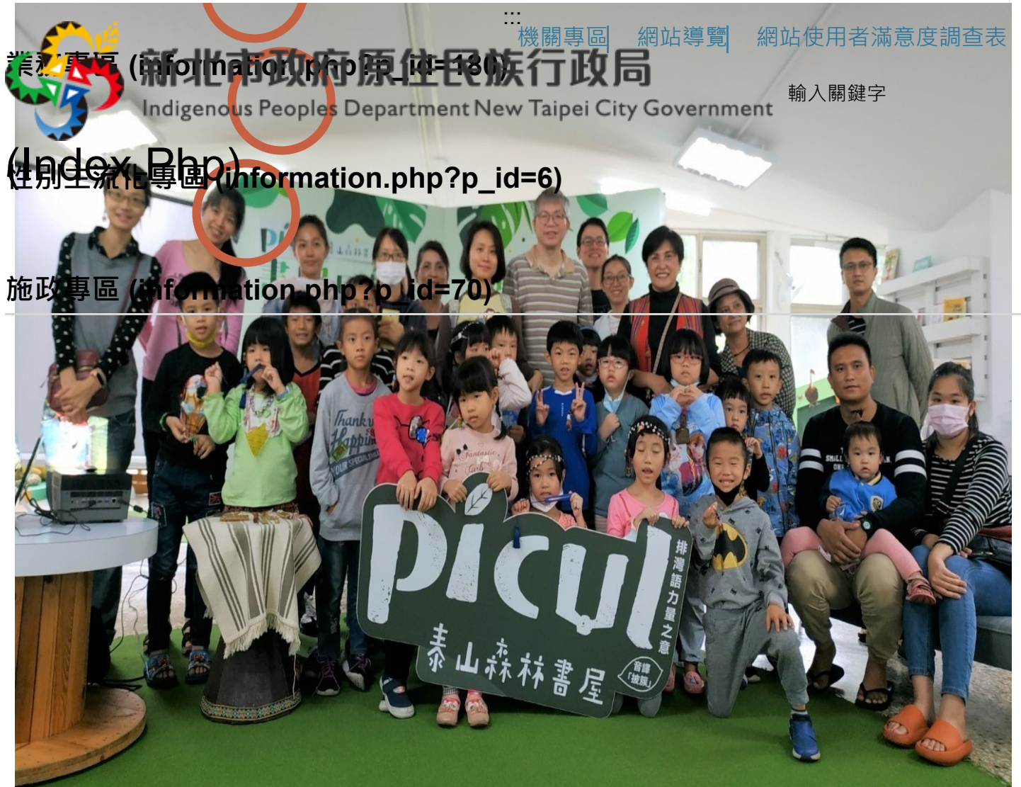
▲ Picul泰山森林書屋-彩虹橋上的天籟泰雅口簧琴活動圓滿完成。