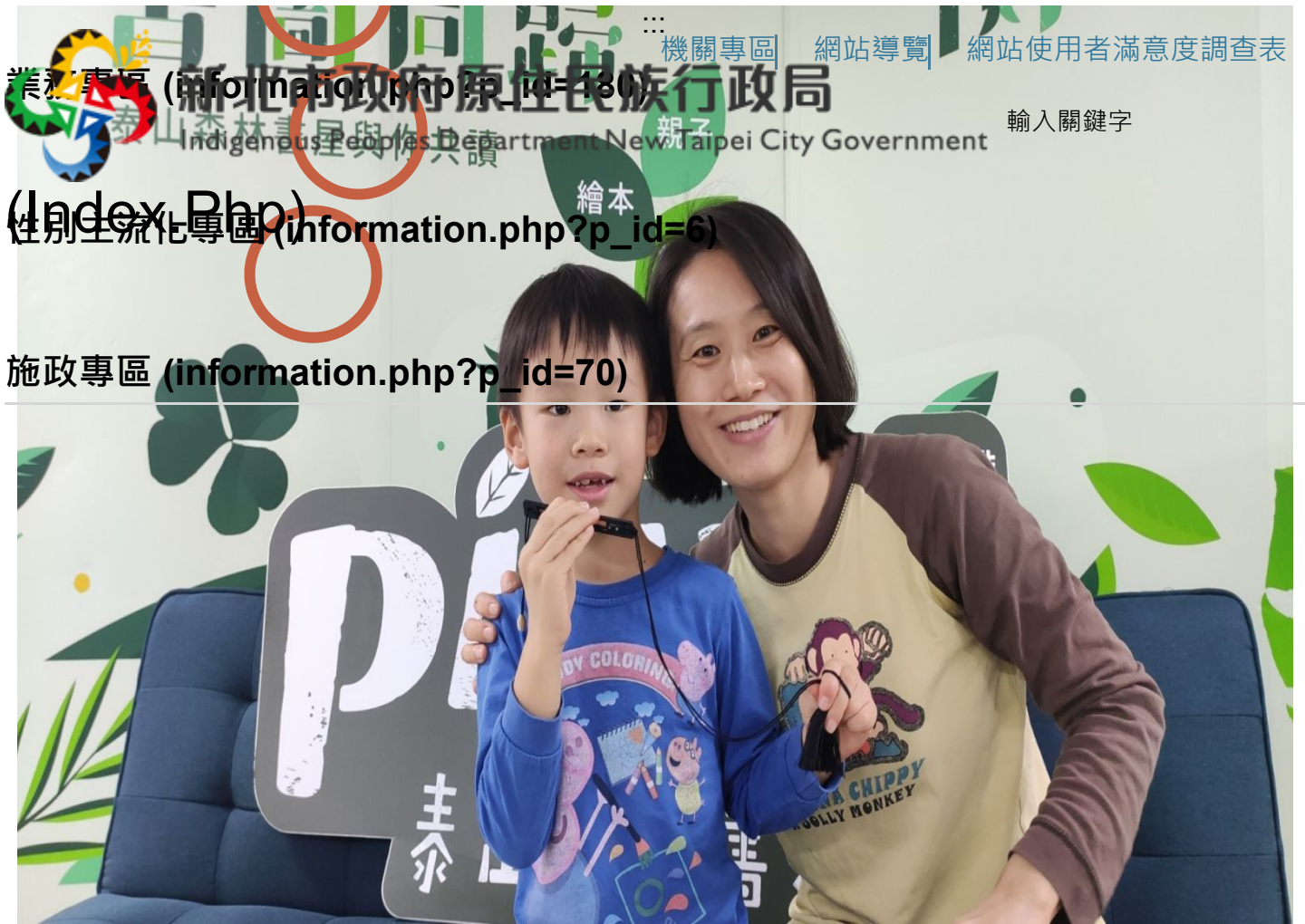
▲ 媽媽帶著小朋友來到Picul泰山森林書屋參加活動，覺得活動新鮮又有趣，還可以認識原住民族的文化，下次活動一定還會再來。

訊息公告 ( information.php?p_id=175 ) 關於本局 ( information.php?p_id=2 )