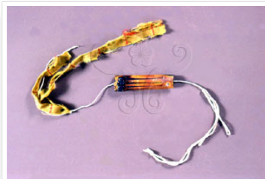
* actatl00111040000pp02 * ##