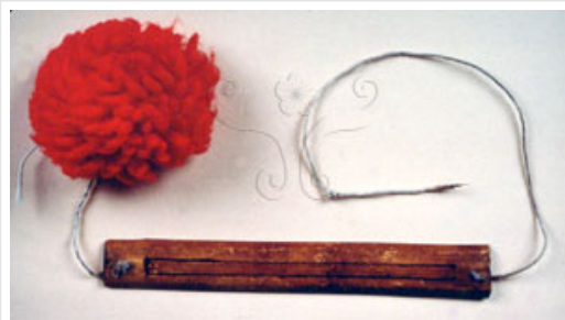
* actatl00111040000pp01 * ##

口簧琴是一種構造簡單，攜帶方便的小型樂器。主要部分為琴身與琴簧，一般琴身皆為竹製，琴簧則有竹製與黃銅片製兩種；尤其銅製簧片數特別複雜，除單簧口琴外，還有雙簧、四簧甚至有七簧、八簧口琴。簧片寬窄厚薄不同，可以產生高低不同的音階；泰雅族中以一簧與四簧最為普遍。