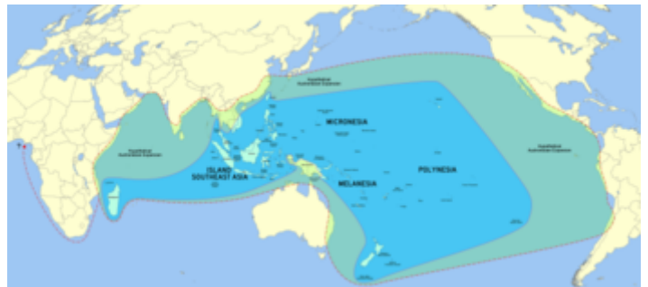
當代南島語系分布範圍和可能接觸區域

人類學家凌純聲認為百越族為台灣原住民族的先祖，也是南島民族的祖先。但是從語言學分析，這個假說仍有爭議，主要是因為漢語和古代百越人的語言與南島語之間沒有直接關聯性。語言學家李王癸則認為，從語言的關係看，古代漢民族、泰傣民族、南島民族的地理：分布應該是漢民族在北，泰傣民族居中，南島民族在南。換言之，漢語與傣語有密切的接觸，傣語與南島語也有密切的接觸，但漢語與南島語卻沒有直接接觸的語言證據。