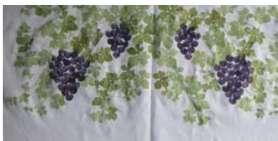
賽芻豆花與山苦瓜葉之拓染作品