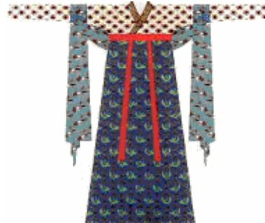
隋朝時期的短襦、長裙、披帛女服穿戴。