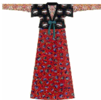
隋唐襦裙、半臂穿戴。