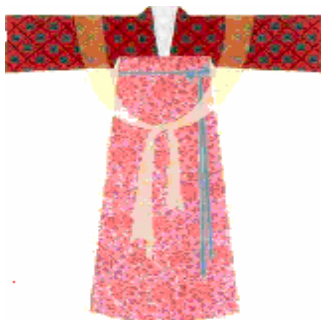
中唐的襦裙、披帛穿戴。