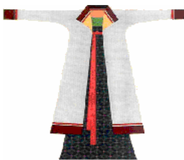
隋朝時期的短襦、長裙及翻領窄袖女服穿戴。