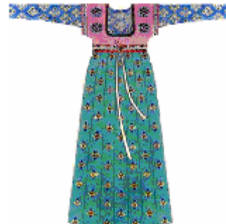
領套衫半臂及襦裙穿戴。