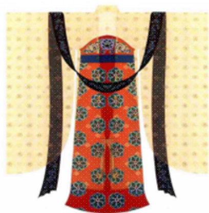
圖六 大袖衫訶子裙