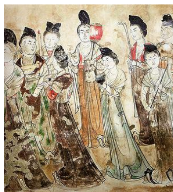
(圖 1-2) 唐永泰公主墓

袒胸裝(袒領上襦)，胡服影響逐漸減弱，盛唐以後女服衣袖日趨寬大，唐代在上襦領口上有多種變化，甚至大膽改革發展出袒領，凸顯頸部曲線與胸部，初唐歐陽詢《南鄉子》：「二八花鈿，胸前如雪臉如花」，方乾《贈美人》：「粉胸半掩疑晴雪」，皆是對袒胸裝的形象描述，大袖衫也是反映當時婦女思想開放的服飾，周昉《簪花仕女圖》(圖 1-3)婦女身著高腰長裙，手臂裸露，披透明紗衣，外罩大袖衫，唐永泰公主墓中壁畫也可見婦女著袒胸上襦(圖 1-2)，可見其開放。