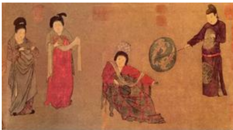
(圖 1-6) 周昉《紈扇仕女圖》壹讀。2018 年 3 月 24 日，取自 https://read01.com/GdQey.html#.W-WdZJMzZPY