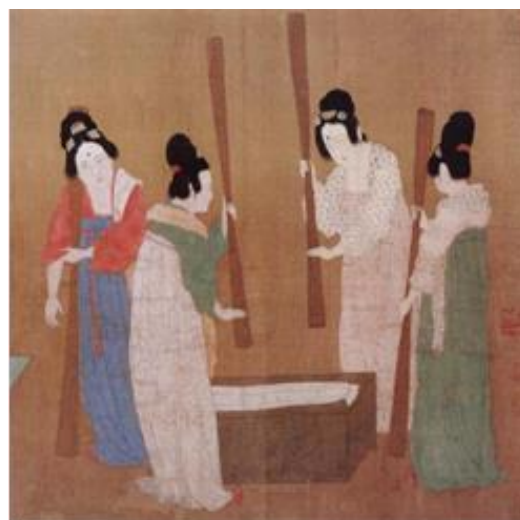
(圖 1-5) 張萱《搗練圖》