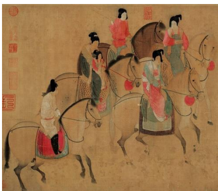
(圖 1-1) 張萱《魏國夫人遊春圖》新華網。 2018年3月20日，取自 http://big5.xinhuanet.com/gate/big5/www.xinhuanet.com/shuhua/2017-05/15/c_1120975376_3.htm