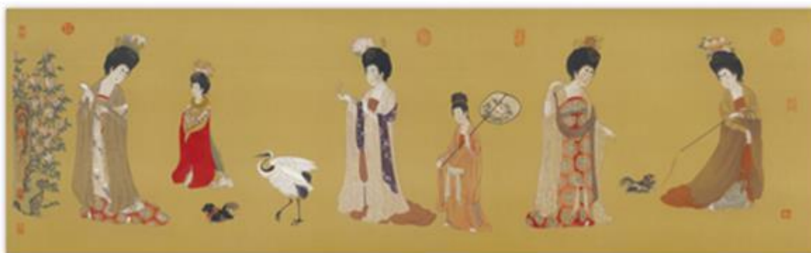
(圖 1-3) 周昉《簪花仕女圖》 杭州市義橋實驗學校。2018 年 3 月 24 號，取自 http://www.hzyqsyxx.com/web/ShowArticle.asp?ArticleID=1319&WebShieldSessionVerify=Gi9BCeBSz9rvkXTkwTk0