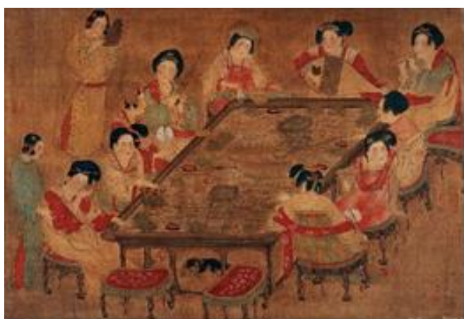
(圖 1-4) 《宮樂圖》大紀元文化網。2018 年 3 月 24 日，取自 http://www.epochtimes.com/b5/3/8/21/n363129.htm