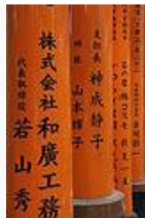
日本京都伏見稻荷神社前鳥居上奉獻者的題名