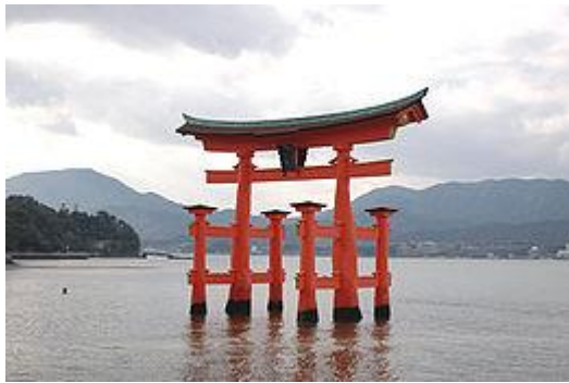
屬嚴島神社管理的海上鳥居

致使用者：請搜尋一下條目的標題（來源搜尋："鳥居"—網頁、新聞、書籍、學術、圖像），以檢查網路上是否存在該主題的更多可靠來源（判定指引）。