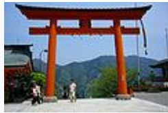
熊野那智大社 二的鳥居