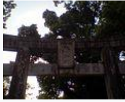
福岡縣春日市春日神社（寶永七年奉納）