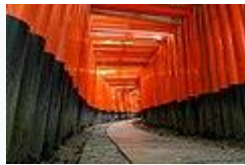
京都伏見稻荷大社境內鳥居甬道（千本鳥居）