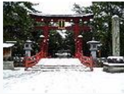
氣比神宮的大鳥居