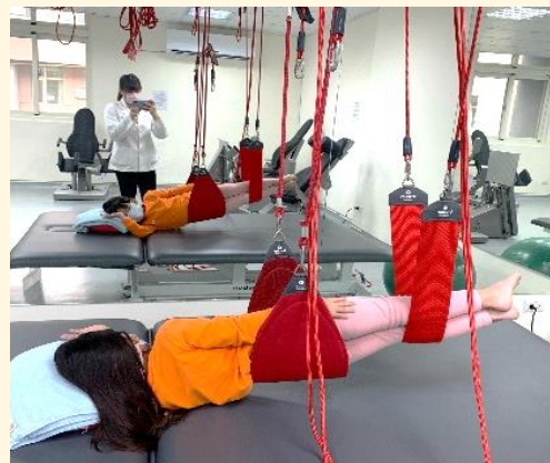
利用『挪威紅繩懸吊系統』矯治