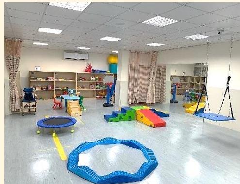
個別化設計活動關卡

影響姿勢的原因多種多樣，在經過復健科醫師檢查骨骼肌肉結構上的問題後，會由治療師為小朋友量身訂製個別化的運動訓練、衛教正確的姿勢，並適時轉介，讓小朋友能夠早期接受治療矯正。