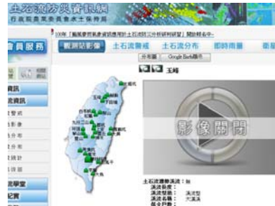
圖 2 土石流觀測站影像(一)

日本全國每所小學，都會在九、十月舉行一次師生及家長共同參與的「接領學童避難訓練」。家長們在接到緊急聯絡網的電話後