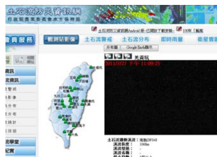
圖 4 土石流觀測站影像(三)