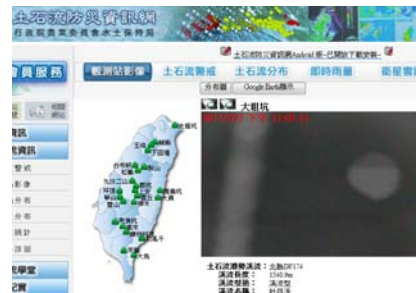
圖 3 土石流觀測站影像(二)