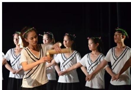
圖 10 西拉雅白色上衣與黑長裙穿著