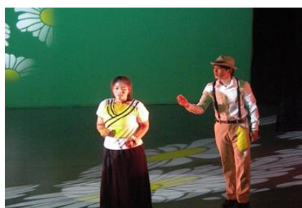
圖 7 南國野菊花以舞蹈與戲劇形式演出

劇為輔的演出型式，內容情節以西拉雅女兒一生的歷經起伏為主軸。並運用了西拉雅涵蓋土地、儀式與服裝等元素，來強化舞臺演出所要傳遞的西拉雅文化訊息及舞作西拉雅風格的歸屬性。另外，有觀眾詢問不解為何全場以白衣黑裙為主要穿著，經演出單位說明後，觀眾也由舞蹈藝術的演出中，間接了解到西拉雅族的穿著文化。為靈龍舞蹈團以舞蹈藝術傳揚傳統文化之初衷精神再添一筆效益。