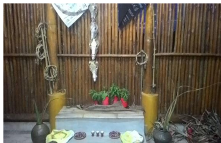
圖 1 番仔田復興宮公廨中供奉阿立祖

西拉雅族信奉阿立祖，並在公廨中供奉以各式瓶壺為代表的阿立祖，這些瓶壺中，裝有水並插有綠葉，代表著西拉雅族所信奉的阿立祖。