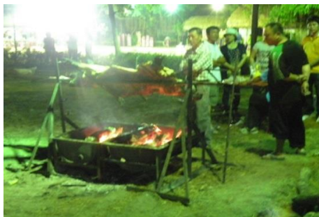
圖 5 北頭洋夜祭周遭烤豬分饗民眾

地婦女組成，手牽手圍成圓圈，配合自哼的曲調，踩出反覆的舞步（圖 6），順著反時鐘方向進行，男性祭司（即當年度的尪姨）則順著圓圈走，一路噴灑米酒，舞蹈進行直到男性祭司（即當年度的尪姨）指示停止為止，整場夜祭活動宣告完成。