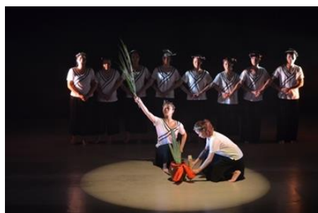
圖 8 西拉雅夜祭尪姨主導地位