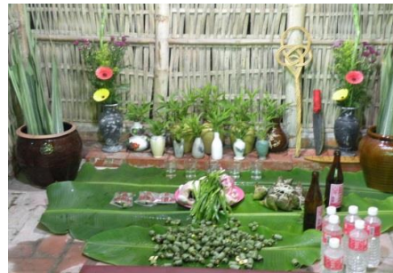
圖 2 佳里北頭洋公廨中供奉阿立祖