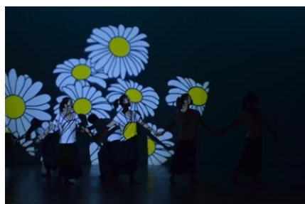
圖 9 南國野菊花演出場景