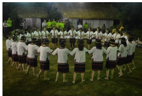
圖 6 北頭洋夜祭牽曲