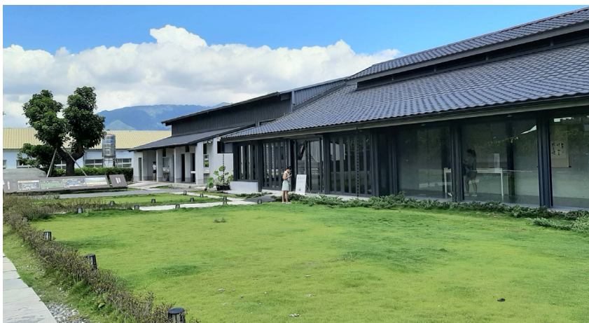
●〈池上穀倉藝術館〉營造一方結合在地特色與建築美學的空間。