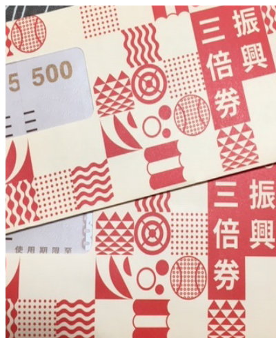
●振興券的推行確實存在許多瑕疵有待討論，但仍有賴你我響應。

由蔣勳擔任總顧問的〈池上穀倉藝術館〉，以簡潔的建築改造穀倉，營造一方結合在地特色