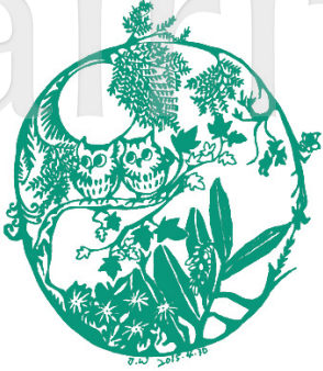
●萬有均為祢所賜（圖/王貞文）