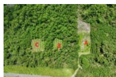
圖二: 實驗林灘地 ABC 圖