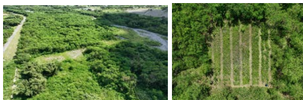
圖五: 灘地原生樹種現況分布圖 (遠圖)

由於原生樹存活率很高，致使銀合歡沒法霸佔土地，尤其在有樹蔭底下的地被植物長得更茂盛了。以下大致以空拍圖來描繪 ABC 區的情形如: