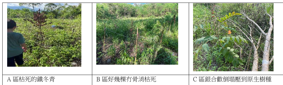
圖五: 颱風後原生樹種狀態圖