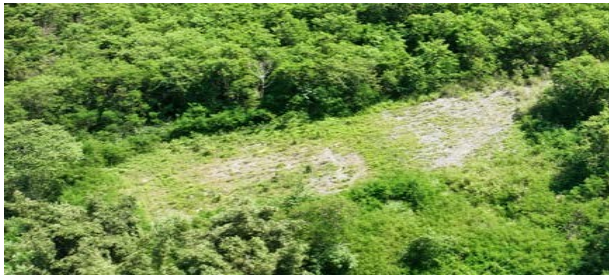
圖七: 打敗銀合歡的灘地生態