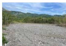
圖三: 灘地整地後 A 區狀況圖