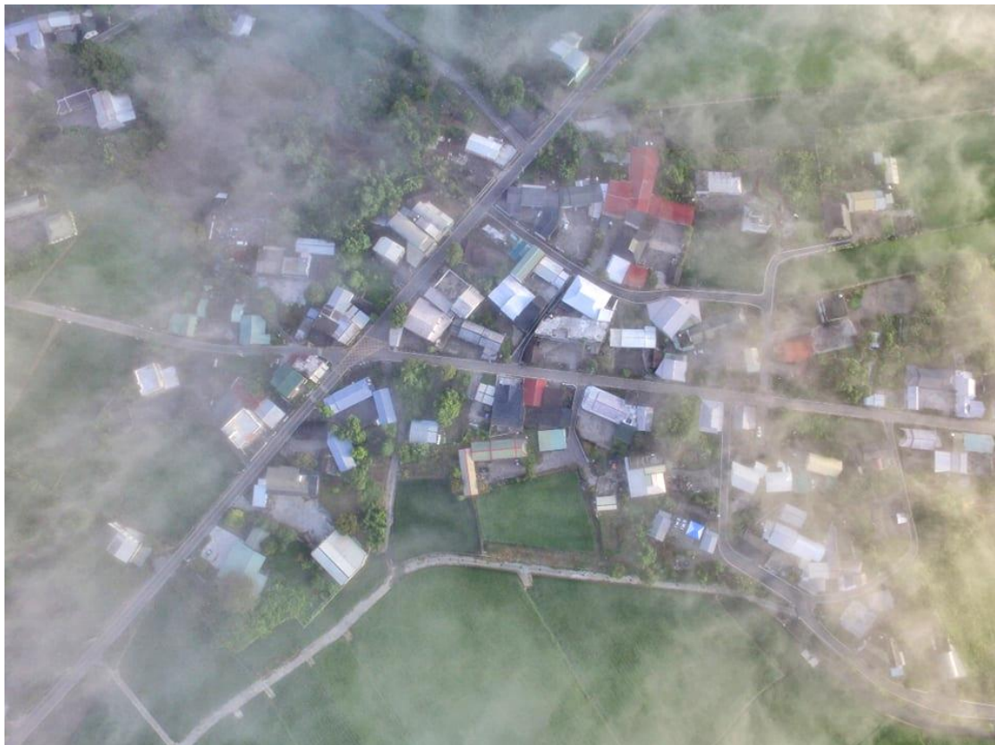
圖 1-1 里行部落

走在路上這個要叫「阿公仔」那個要叫「阿婆仔」，在這些長輩口中得知我們都有親戚關係。因此我們就在想，我們從哪裡來？我們是什麼人？為何我們會聚集在明里。後來部落的長輩們開始在「台東麥堤伊馬卡道族文化復振協會」引導，我們開始認識到我們可能是平埔原住民族，後來每個禮拜練舞、練唱傳統歌，歌曲裡面很多阿公仔、阿婆仔他們常常在說的話，心裡又多了更多的問號？會想要問阿公仔、阿婆更多的故事。於是開啟了我們想要尋根、知道我們身分的渴望，長輩帶我們一起調查日治時期的家系譜、陪阿公仔和阿婆仔聊天說故事，阿公仔跟阿公仔之間的關係的讓我們越來越清楚我從哪來，耆老訪談讓我們了解部落的過去與現在。2019年開始，我們也參與了部落舉辦的馬卡道族夜祭，那是我們第一次知道我們也有祖靈壺，且他數百年來都存在於最關心我們的長輩的家中。祭典裡我們被要求著「報信」，繞著部落跑，長輩說，「報信」是跟部落報告我們的祭典要開始了，跑步時鈴鐺噹噹的，告訴著部落「開始囉，大家一起來準備祭典喔」。原來這些文化都在我們的身邊，只是我們不知道。為了讓自己更能認同、了解自身文化，我們也要一步一腳印陪著長輩們實際踏查，了解老人家的故事、精神並將明里部落的文化延續傳承下去