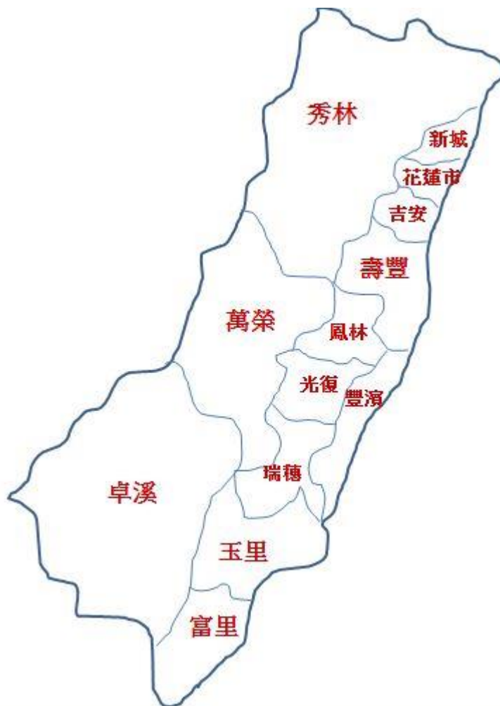
(圖一) 花蓮縣鄉鎮市區域圖

由上所述可知，早期到河東開墾的原住民多半從北邊南下，發現河東地區是一個土地豐饒肥沃的區域，因此就定居下來。