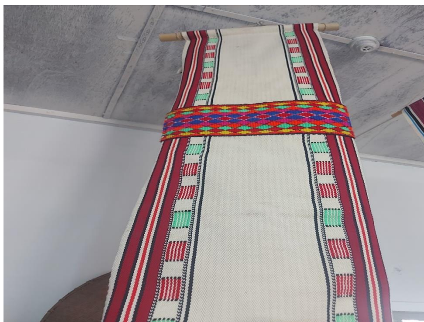
圖六：布農族男子無袖長背心（habang）背面部分（還沒製成背心的布匹）

女性織完的布匹大多是做成男性的衣物，最具代表性就是布農男子無袖背心背面的布，那個是需要用很高超的織布技法才能織成的，女性織的越好，愈會凸顯男性家族成員在人群中特別出色，另外讓人知道女姓家族成員的手藝很厲害。