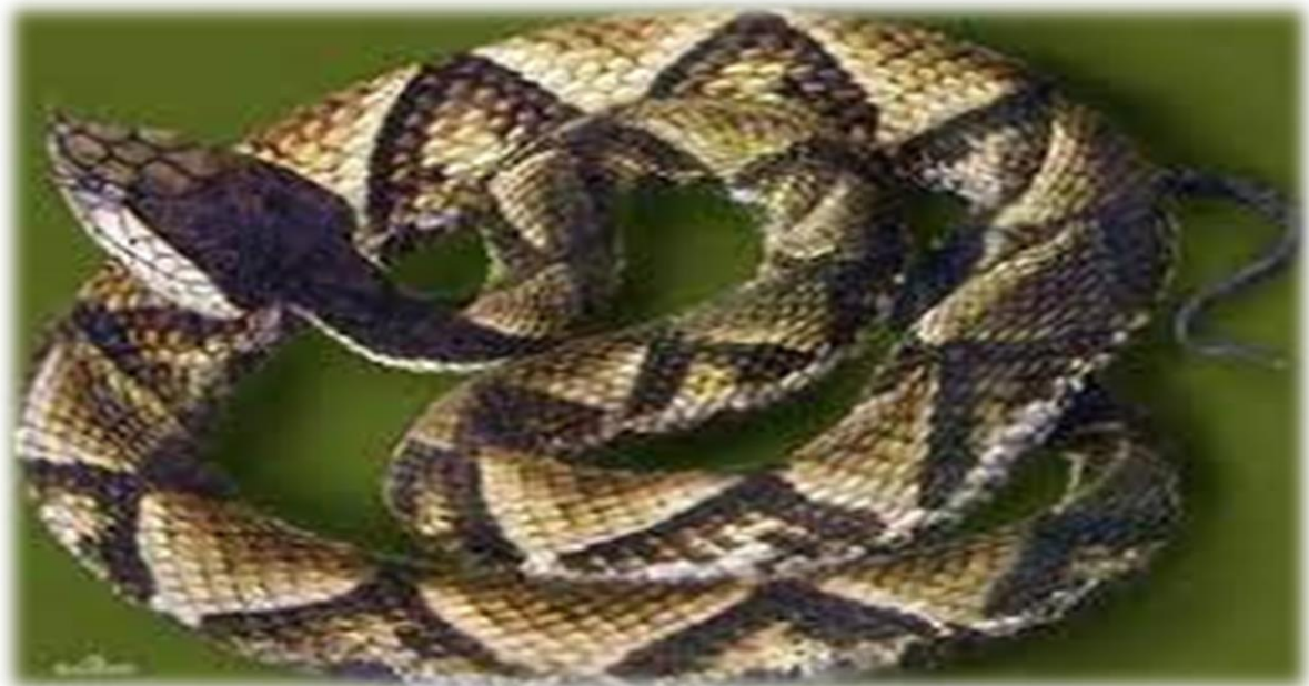
圖四：百步蛇的菱形花紋

「從前有一位婦人苦苦尋思要幫丈夫的衣服織什麼花樣時，她看到小百步蛇上的花紋很漂亮，於是就和百步蛇媽媽借一條小百步蛇回家。其部落裡其他婦人看到後也覺的小百步蛇身上的花紋很漂亮，就紛紛來跟婦人借小百步蛇，但不幸的是，小百步蛇再借來借去的過程中不幸死亡。百步蛇媽媽得知後非常生氣，於是率領眾多百步蛇與布農族人抗戰，雙方死傷眾多。最後頭目和百步蛇相互協議，百步蛇願意將身上花紋借給布農族人做織布參考，帶布農族人必須有善對待百步蛇。」 3