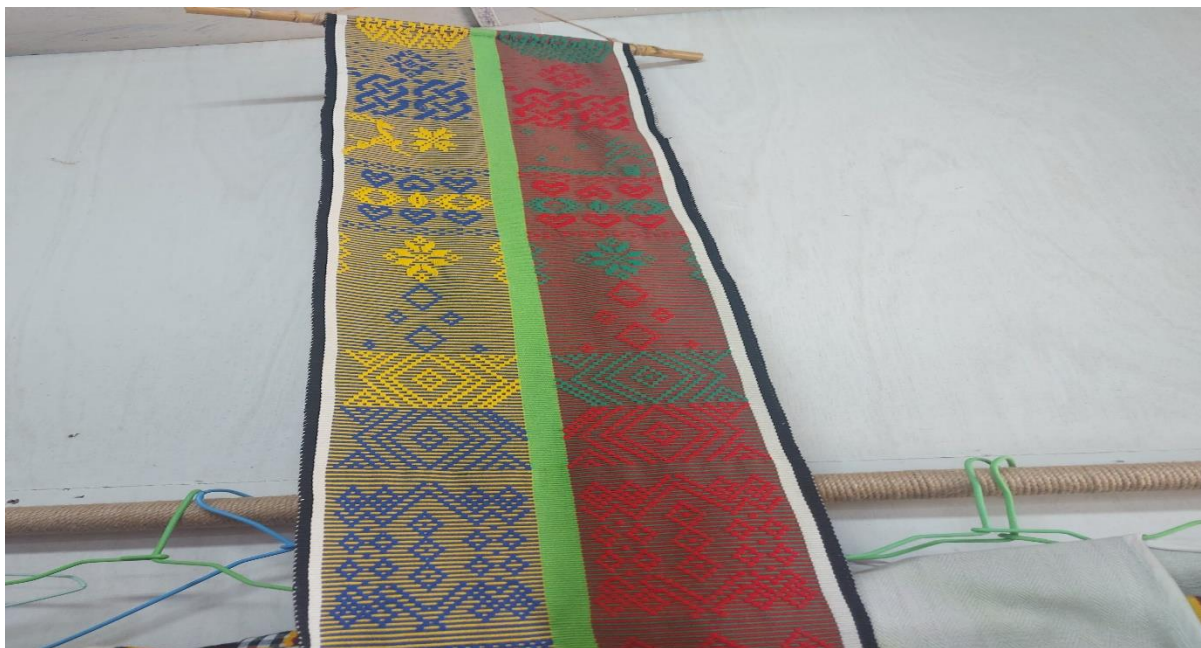
圖五：布匹上的菱形花紋與百步蛇的菱形花紋相似