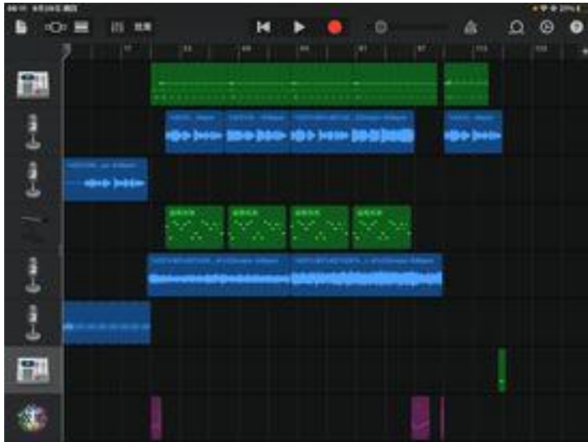
圖三(第一、四個音軌為貝斯及鼓機，第二、五音軌為原版音檔)