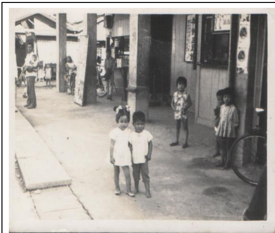
圖一：舊時大同戲院剪票入口

大約在西元 1960 年時， 豐田村 因開採 豐田玉石 ，當時的社區呈現一片繁榮景象，街上隨處可見人山人海的景象，當時村落也介於經濟發展的巔峰時期，富足的日子也讓人們開始注重生活中的娛樂，因此 大同戲院 就在這樣經濟快速發展的時期誕生了。