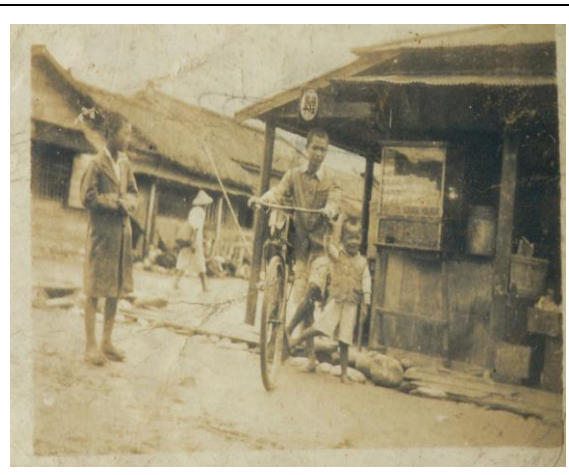
圖二：舊時大同戲院路口一隅