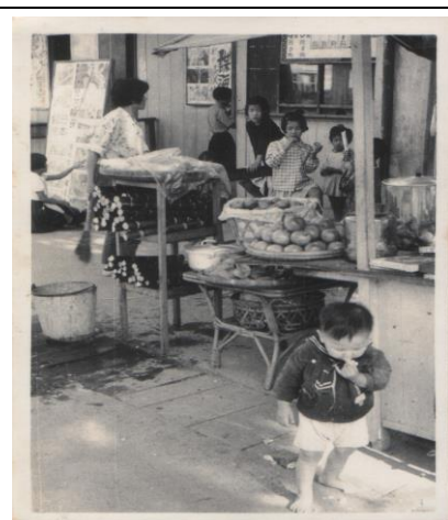
圖四：舊時大同戲院入口的餐飲部