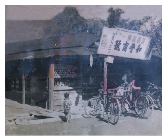
圖三：大同戲院旁的販賣部