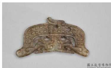
圖十八 獸面紋玉珮

亦作玉珮。古人佩掛的玉制裝飾品。權德輿《贈友人》：「知向巫山逢日暮，輕掛玉珮暫淹留。曉隨雲雨歸何處，還是襄王夢覺愁。」顧況《金璫玉珮歌》：「贈君金璫太霄之玉珮，金鎖禹步之流珠，五嶽真君之秘篆，九天丈人之寶書。東井沐浴辰已畢，先進洞房上奔日。借問君欲何處來，黃姑織女機邊出。」