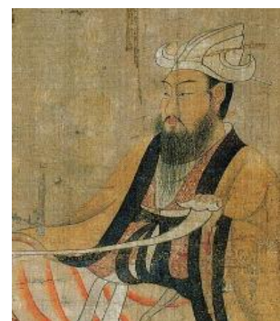
圖十五 頭戴白紗帽的陳文帝 (維基百科)

在《簪中錄·第一簪》第十五章中皇帝和皇后參加她名義上妹妹的喪禮時「兩人都是素白縹絲常服，皇帝戴了白紗帽，皇后頭戴著粉白色珠花步搖」。由此可見白紗帽只能與特殊場合供皇帝穿著，更能顯現出隆重肅穆的氣度。