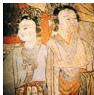
圖五 穿半臂襦裙的侍女 (國際傳統服飾與文化研究中心)

在《簪中錄·第一簪》第五章中，準王妃王若在接待假扮成宦官的女主角時，穿著「今日王若的打扮與前日不一樣，一身藕荷色 短襦半臂 ，這麼活潑的衣服樣式上，用了紅色牡丹花紋，便顯出一種歡快流暢的華美來。」由此可知，短襦半臂在唐代是年輕女子喜愛穿著的服飾之一，更能展現出年輕女子的清純自然。