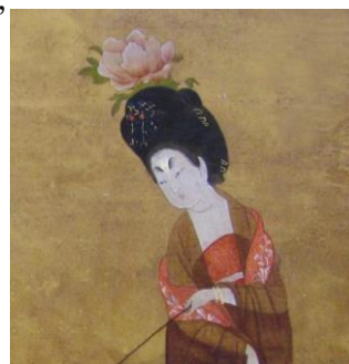
圖二十一 簪花仕女圖(局部) 配有纏臂金 (遼寧省博物館官方網站)

盛唐和宋朝時流行，明代後逐漸走向沒落。女人佩戴纏臂金，這件首飾形態與體態豐盈的大唐美女極為相配。在知名的《簪花仕女圖》當中，就可見到纏臂金出現在仕女手腕上，可見在唐朝時期，纏臂金就已經是唐朝婦女普遍配戴的飾品之一。