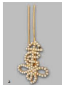
圖二 嵌珍珠壽字金釵

用於固定髮髻，與簪不同的是，簪為單股而釵為雙股，因為金釵雙股的特徵，常被用來象徵人與人之間的分合，甚至其中一股被當作情侶間的信物，如杜牧〈送人〉：「明鏡半邊釵一股。」、白居易〈長恨歌〉：「釵留一股合一扇，釵擘黃金合分鈿。」