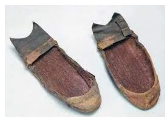
圖十七 絲履

在《簪中錄·第一簪》第十章中，夔王妃失蹤時，她身上穿著「一襲黃衫，頭上鬆鬆挽著一個留仙髻，腳上一雙素絲履，和失蹤那日一模一樣。」其中的絲履，指以絲織品製成的鞋，是古代華貴的服飾。從這裡看到知道絲履主要是由絲這種材質編織而成的，想必是需要一定的財力才能擁有，所以是貴族女性才能有這種財力去製作一雙屬於自己的絲履。