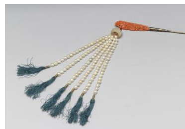
圖三 珊瑚珠玉步搖 (國立故宮博物院官方網站)

在簪和釵首上，飾有一串垂珠，或綴有活動的花枝，行走時，因隨之搖頭，而稱為「步搖」。劉熙《釋名》記載：「步搖上有垂珠，步則搖動也」唐詩中也可見到步搖搖動、發出聲響的特色。如薛昭蘊《浣溪沙八》：「步搖雲鬢佩鳴璫。」璫為耳環之意，即行走時，髮上步搖和耳璫一起搖動。(楊雅琪〈從《全唐詩》看唐代婦女服飾〉，2007)