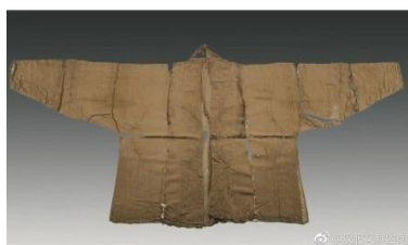
圖六 安徽南陵鐵拐宋墓出土窄袖襦子

在《簪中錄·第一簪》第四章中，男主角在自己殿中院落觀賞風景時，穿著「腰間是仙人樓閣紫玉佩，系著九結十八轉青色絲條，袖口領口是簡潔的窄袖方領，正是京中競相效仿的式樣。」從這裡可以看到，皇室貴族間流行，且因具有皇室的氣度與氣魄，才會讓民眾爭相模仿此種穿搭。