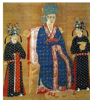
圖十三 穿著翟衣的皇后座像

《簪中錄》中的女主角原來要與自己年少時訂下的未婚夫成婚時，她的嫁衣十分特別，因為「她父親曾是蜀地郡守，王蘊身為御林軍右統領，父親王麟又是尚書，她的嫁衣自然便是翟衣。」可知翟衣是唐代后妃與官員命婦的禮服，她們都會在重大場合穿上這種禮服，帶有莊重、嚴謹的形象。