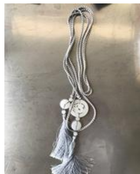
圖二十 絲條

是古人腰間懸掛飾物的一種像布條似的東西，用來繫玉佩、金飾等物。或宮中特製或仿照宮樣所製的絲帶。一般是晚清以前，古代人們習慣把絲帶稱之為絲條。賀之章《詠柳》:「碧玉妝成一樹高，萬條垂下綠絲條。」