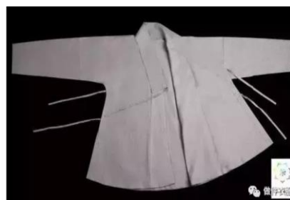
圖十 漢服中衣 (漢服網)

古時穿在祭服、朝服內的裏衣，多為素色、無花紋且衣領與衣身同色，類似後世的汗衫，如青鮮支中單和葛中單。「中衣」專指衣長齊胯到齊大腿不等的上衣(下身會配中褲或中裙)，「中單」則專指身長齊腳的中衣，但一般以「中衣」一名概括兩者，在《禮記·郊特牲》：「綉黼丹朱中衣」、《後漢書·輿服志上》：「大夫台門旅樹反玷，綉黼丹朱中衣」中可見得。