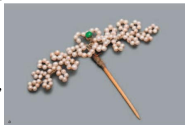
圖一 珍珠髮簪

唐代婦女所使用的髮簪材質使用非常多樣,包括金、玉、水晶、犀角、玳瑁等。如韋莊《閨怨》：「鏡破金簪折。」、錢起的《送畢侍御謫居》：「崇蘭香死玉簪折。」以及和凝的《宮詞百首》：「芙蓉冠子水精簪。」等，都表現了簪對於唐代婦女，不只是十分重要的飾品，更成為了女性身份的象徵物。