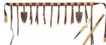
圖十九 狩獵紋金蹠躩帶 (中國金沙遺址博物館)

貯放火石的袋子，古代作為一種服飾。《舊唐書·輿服志》所記載的蹠躩七事，指的是在官員配戴的革帶上必須懸掛七件物品，包括:算袋、刀子、礪石、契苾真、噉蕨、針筒、火石袋。