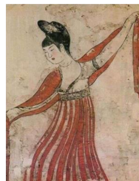
圖十一 霞帔與墜子 (李震墓壁畫)

《簪中錄·第四簪》第一章中，在許多官員的宴會現場時，獻舞的女子們「正聯袂結袖，翩翩起舞。霓裳霞帔，飾珠佩玉，一時華彩遍生。」從這裡可以看到，霓裳霞帔在唐代是女性的重要場合的穿著，能同時表現出隆重和美麗的形象。