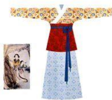
圖九 明月華裙 (百科知識)

根據《釋名》：「裙，下裳也。裙，群也，聯接群幅也。」可知裙屬於下衣。唐代的裙子常是上窄下寬，婦女喜好「短襦長裙」的穿著法：將襦穿在裙之下，以下著蓋住上衣，和後代有所不同。此外，裙的長度也增長，婦女們以穿長裙為美，為表現裙子的長度而出現了高腰裙。如周濟〈逢鄰女〉：「慢束羅裙半露胸」，甚至將長裙提束到胸前，如韓偓〈余作探使以繚綾手帛子寄賀因而有詩〉：「卻繫裙腰伴雪胸」。(楊雅琪《從《全唐詩》看唐代婦女服飾》，2007)