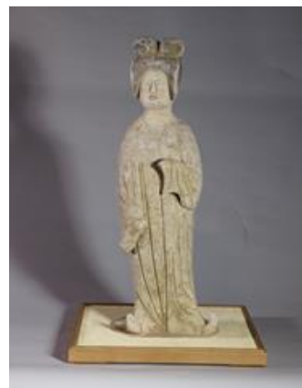
圖十一 灰陶加彩仕女俑

另外，在《簪中錄·第一簪》第十五章的喪禮中「兩人(帝后)都是著素白縹絲常服」。唐代常服主要是袍服樣式，圓領右衽、左右開衩，衣袖可寬可窄，而縹絲技藝自唐朝從用於毛織物轉為用於絲織品，以細蠶絲為經，色彩豐富的蠶絲作緯，並用「通經斷緯」作為原則織造，織成后當空照視其花紋圖案如刻鏤而成。(聯合國教科文組織，中國蠶桑和絲綢工藝 / 漢語網，縹絲)