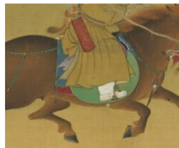
圖十六 著靴騎馬圖(局部)