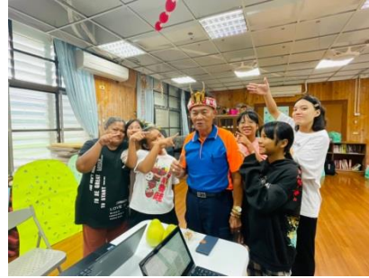
專家訪問-布農族人