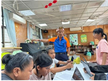
專家訪問-布農族人

常常詛咒 詛咒是 一他 不詛 遭糧 。 的魔法， 聽到他們 會詛咒 那些被 詛咒 的人， 他可 以提 供資 源， 就 會 有 小 孩。 奇詛咒 人， 那 些 都 會 被 詛 咒。 他 祝 福 的 他 方 就 會 有 糧 食。 擁 有 尊 重 對 方 的 報 應， 就 沒 有 小 孩 能 生 活。