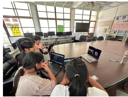
專家訪問(線上)-賽夏族人