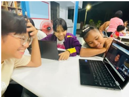
專家訪問(線上)-排灣族人