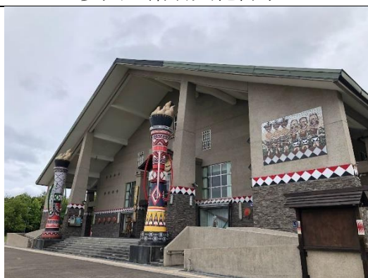
圖2、台灣原住民文化會館外部