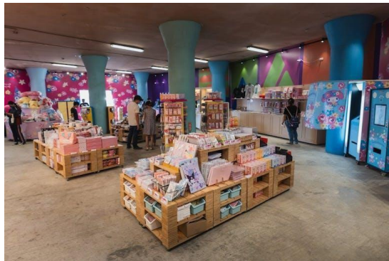
圖8、活動期間限定商店