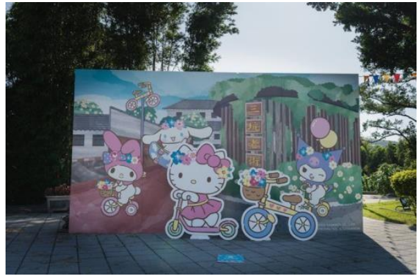
圖7、結合了卡通三麗鷗的裝置藝術