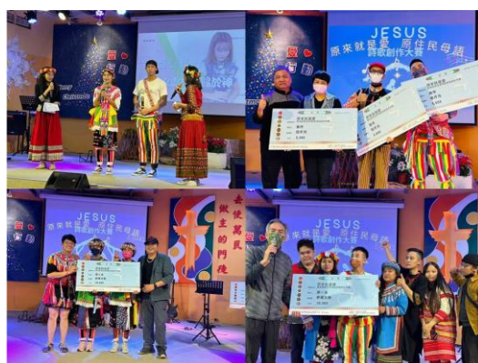
圖5、原住民語的詩歌比賽