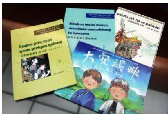
圖4、原住民語繪本及教材