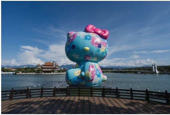
圖6、2023年世界客家博覽會 Hello Kitty 穿上傳統客家藍衫