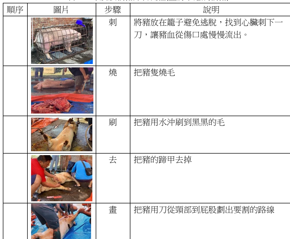
表二：布農族殺豬分食流程(蓋房子落成殺豬)