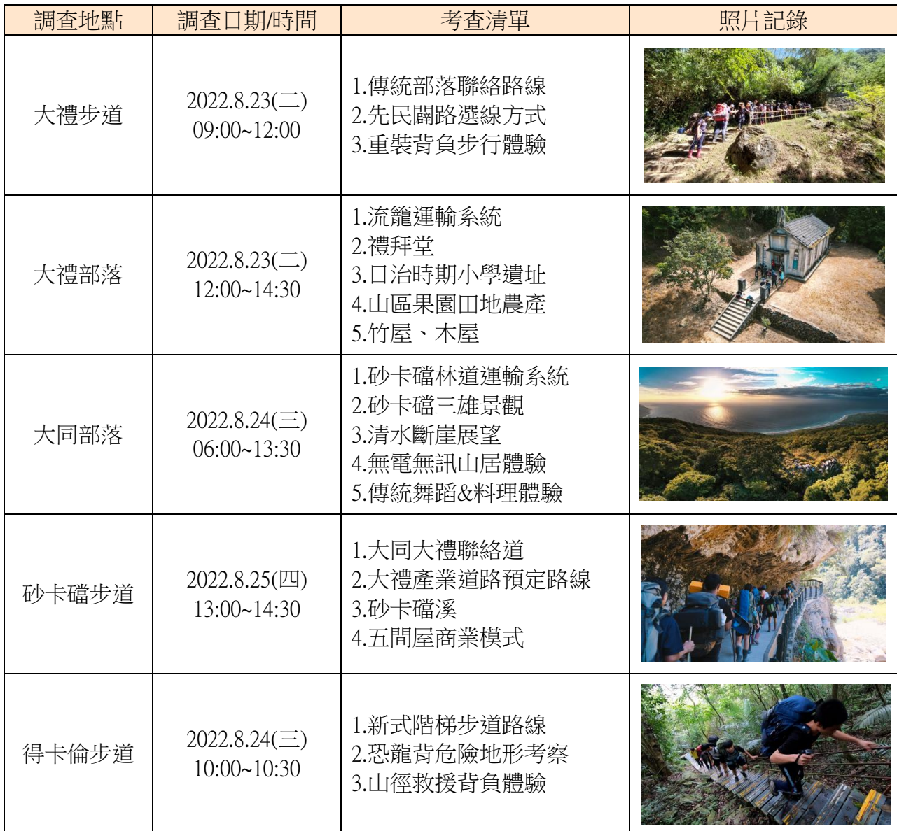
表 3 實地調查場域一覽表

重裝抵達，參訪了日治時期公學校遺址、教堂遺址，也拜訪目前還住在這裡的居民。下山後討論現場觀察的心得，並輔以新聞資料佐證我們的判斷。