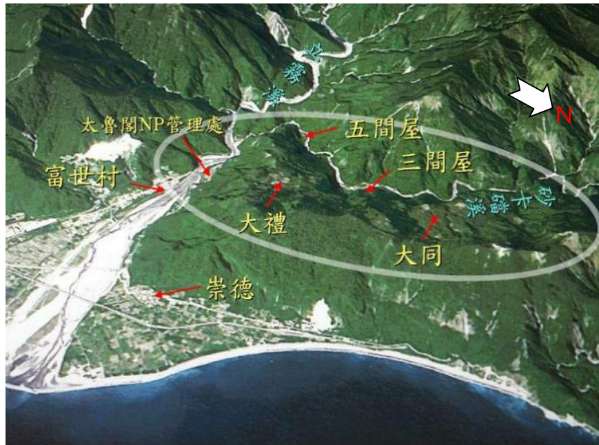
圖 1 研究範圍圖

本研究探討的社區範圍包含大同部落、大禮部落和砂卡礑溪附近等區域，目前有大禮步道、得卡倫步道、砂卡礑步道、砂卡礑林道及大同大禮間步道組成網狀的步道系統，為太魯閣族傳統領域。