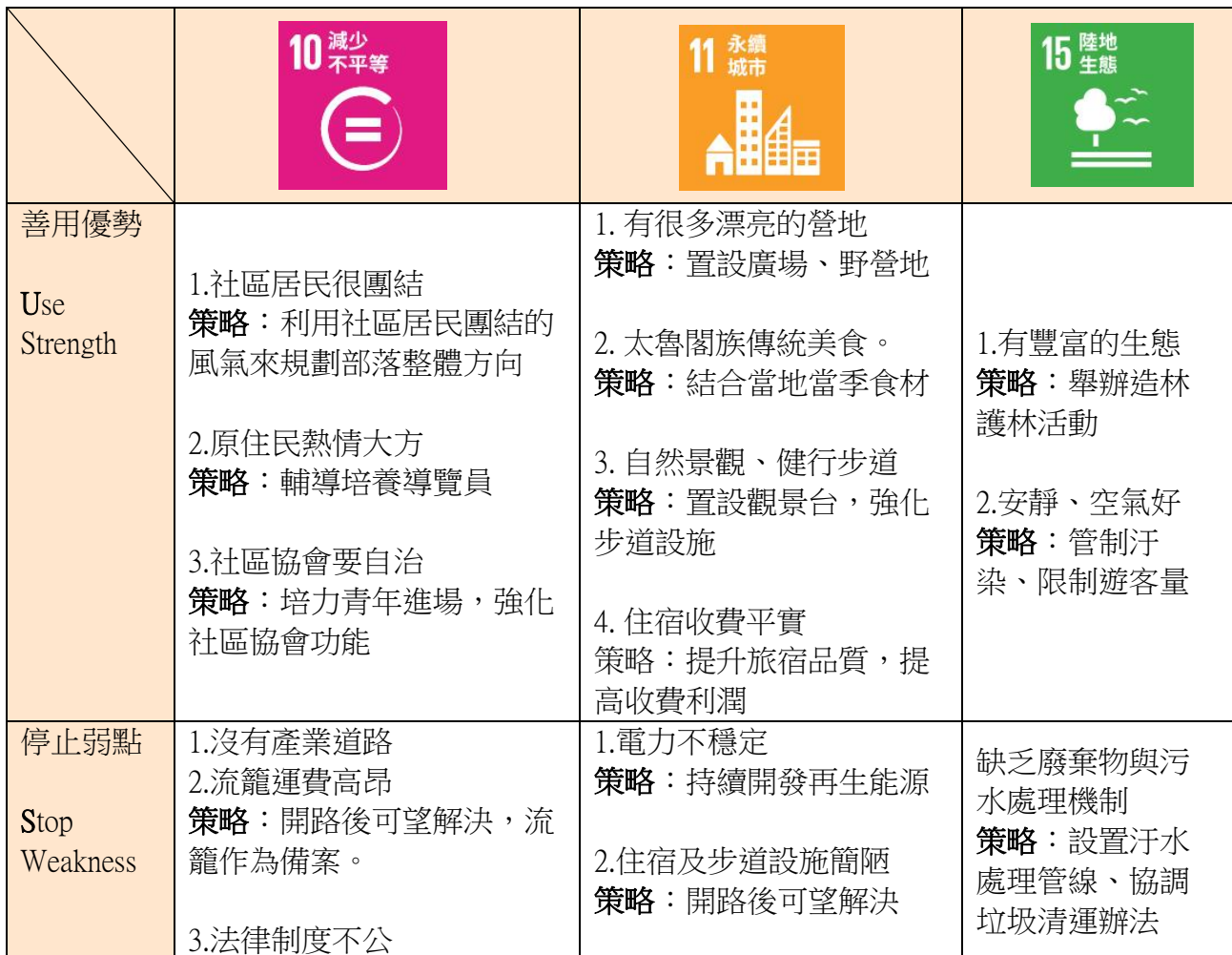
表 6 大同大禮社區 SDGs-USED 矩陣