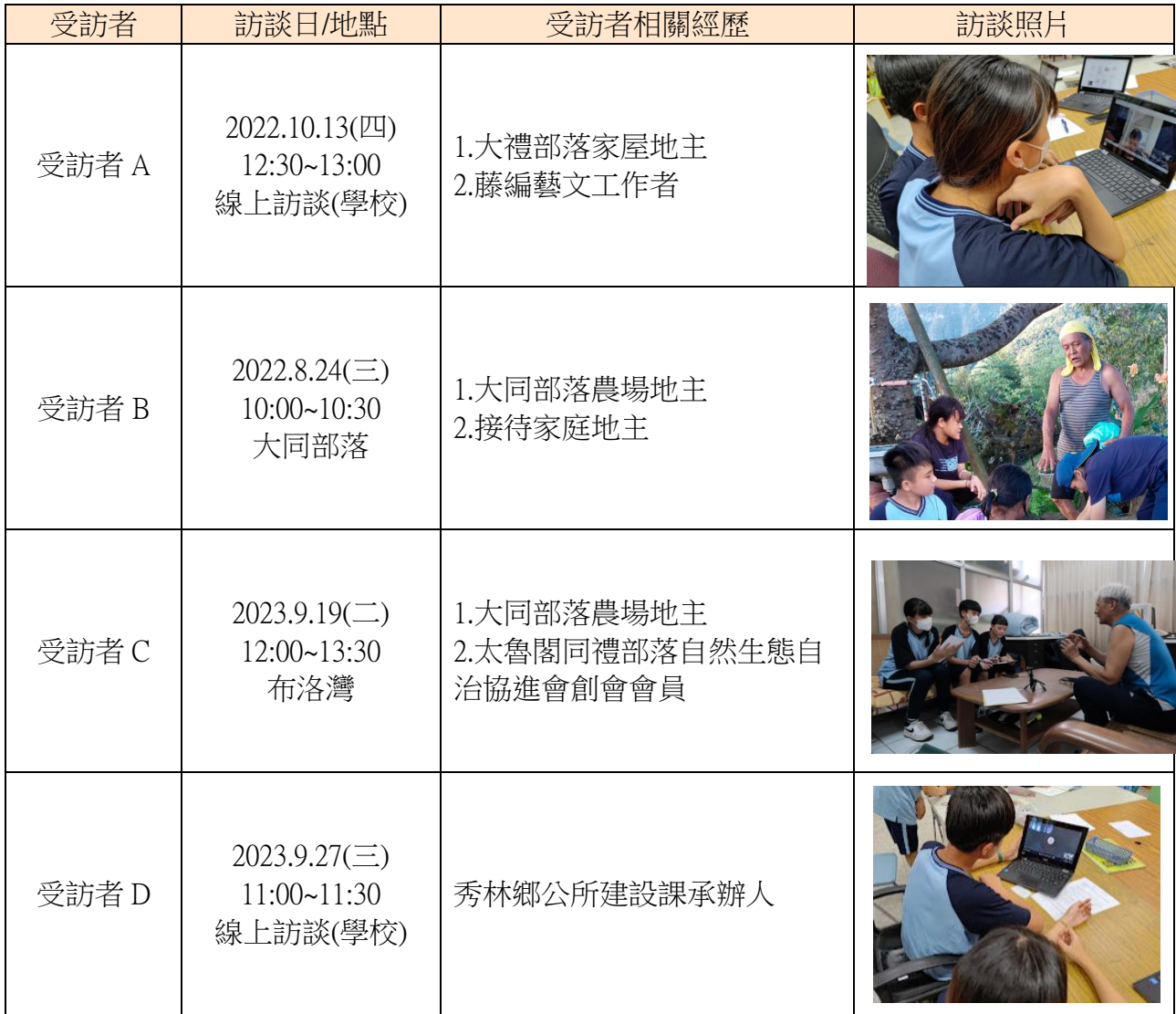
表 4 訪談對象一覽表