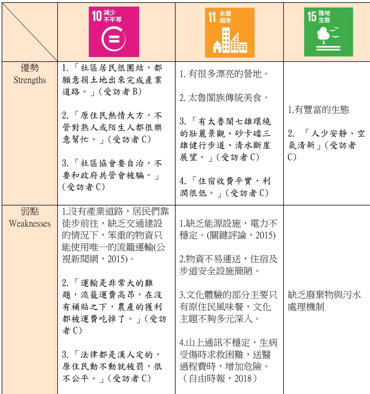
表 5 大同大禮社區 SDGs-SWOT 矩陣