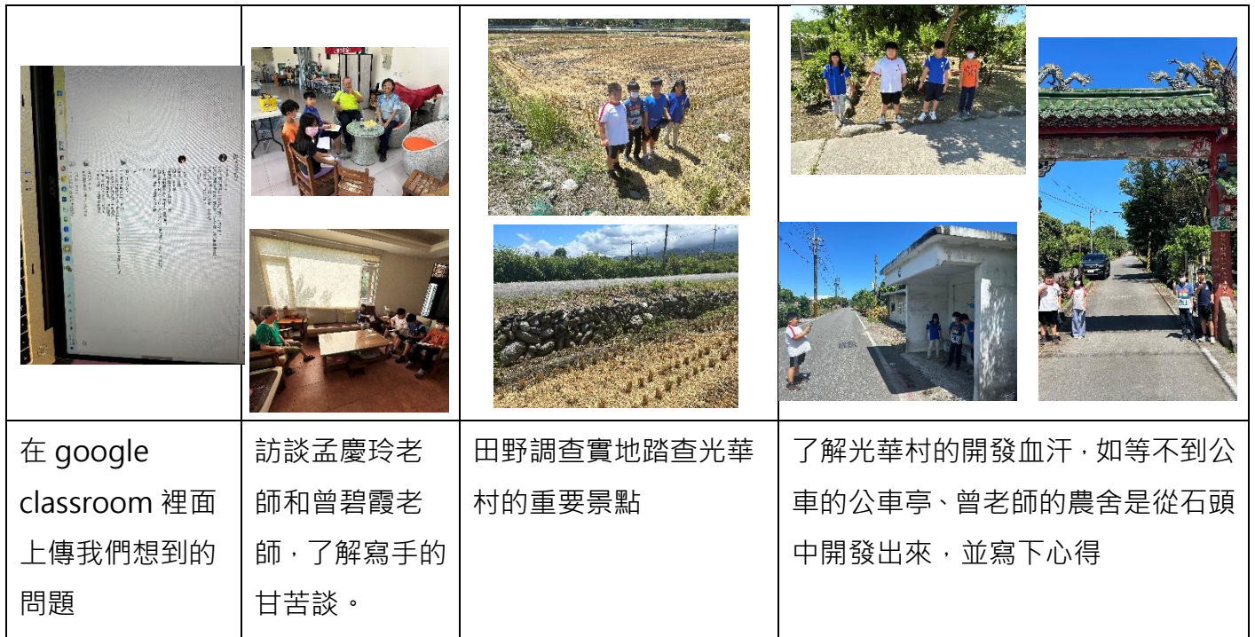
表 4 研究歷程