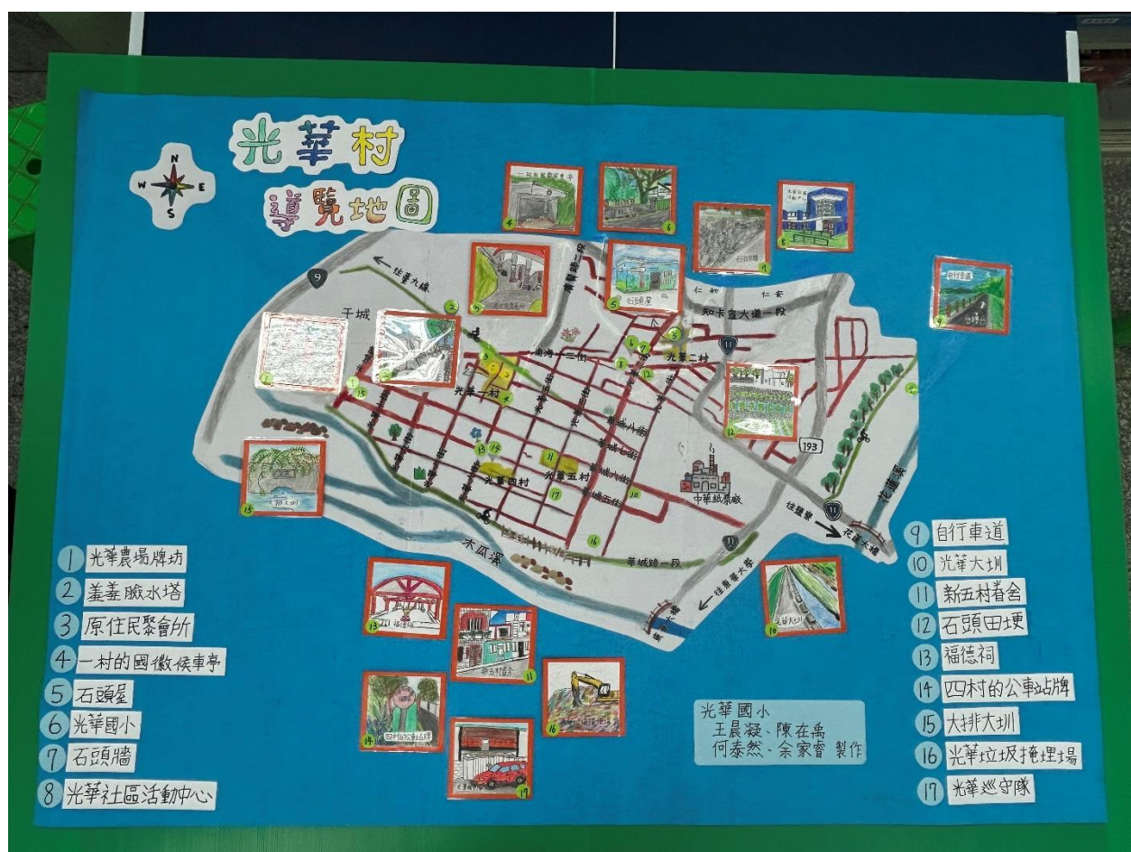
圖 3 孟老師手繪光華村導覽地圖

我們依據孟老師手繪的光華村導覽地圖，在村莊裡走了一遍，並且把重點的文物的位置標記。最後畫在東華大學姊姊們的光華村導覽地圖上，這樣大家就能知道這些「有趣的景點」要到哪裡找了！