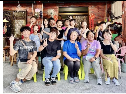
耆老將所知分享給我們