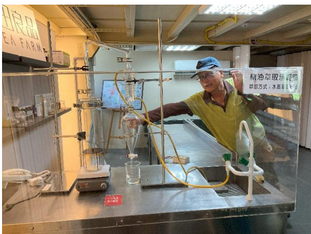
圖三：經理介紹萃取香草的傳統工具。

他們最推薦的茶樹精油，因為茶樹精油有這些療效有：抗菌、抗真菌、抗炎和抗病毒特性，對皮膚和呼吸道健康有益。甚至可以舒緩蚊蟲叮咬和輕微燙傷。所以他們把茶樹精油放在水療成的水池裡，可以充分展現茶樹精油特性，使它的療效會更好。他們秧悅美地用的茶樹是澳洲茶樹，它可以叫做茶樹但是它是不能泡茶，他是不能吃的他是就是拿來體驗精油、殺菌。