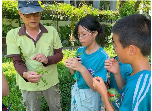
圖一、圖二：經理帶我們認識香草。

他們最推薦的茶樹精油，因為茶樹精油有這些療效有：抗菌、抗真菌、抗炎和抗病毒特性，對皮膚和呼吸道健康有益。甚至可以舒緩蚊蟲叮咬和輕微燙傷。所以他們把茶樹精油放在水療成的水池裡，可以充分展現茶樹精油特性，使它的療效會更好。他們秧悅美地用的茶樹是澳洲茶樹，它可以叫做茶樹但是它是不能泡茶，他是不能吃的他是就是拿來體驗精油、殺菌。