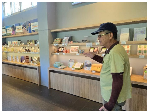
圖六:經理介紹香草的產品。