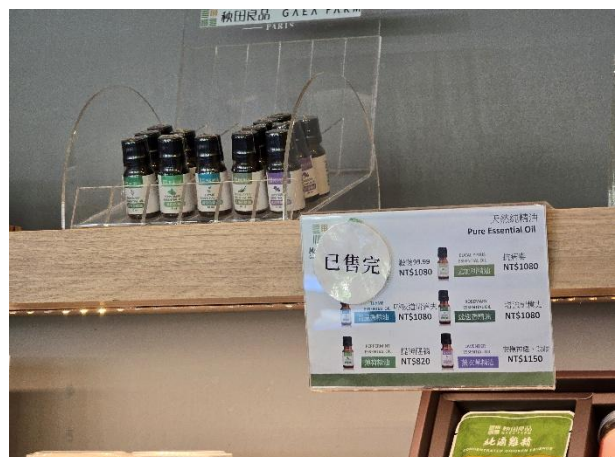
圖四：商店架上的香草精油。