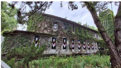
圖 8.船型外觀的新城天主堂