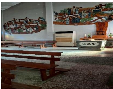
圖 9.船型外觀的新城天主堂