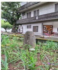
圖 12. 殉難將士瘞骨碑