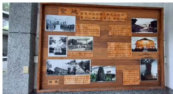
圖 14. 新城天主堂相關建設的介紹看板

(一)歷史古蹟保存狀況良好：新城地區對歷史古蹟的保護程度相對較高，許多遺構至今仍可辨識原貌，並持續發揮文化與教育功能。(二)歷史資訊標示完善在當地仍可見標示歷史事件與建築背景的資訊看板，提供民眾與遊客了解新城事件與神社轉換脈絡的管道。(三)踏查主要觀察透過此次實地踏查，我們獲得以下認知：1.確認日本在新城地區曾進行的基礎建設與治理措施。2.了解日本官方對新城事件的處理方式與後續政策。3.認識日治結束後，在地居民如何保存並延續這段歷史記憶。