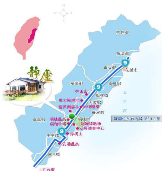
圖二：靜廬名宿之位置圖【註二】

本小組欲探討的特色民宿為花蓮民宿-瑞穗靜廬渡假別墅，民宿位於狹長花東縱谷之重要交通樞紐地帶，也是花蓮全區旅遊分部的中心位置。在本區四周的旅遊聖地有秀姑巒溪泛舟、蝴蝶谷富源森林遊樂區、紅葉溫泉、瑞穗溫泉、瑞穗牧場、舞鶴茶園（咖啡）、光復糖廠、馬太鞍溼地、赤科金針山等。驅車前往兆豐農場僅需30分鐘、海洋公園50分鐘，鄰近瑞港公路直逼東海岸僅有22公里。