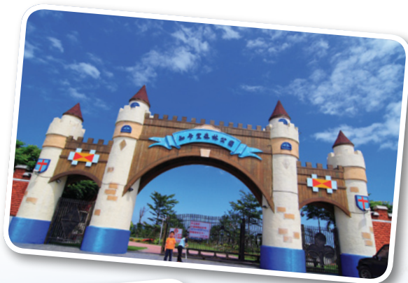
充滿童話意境的大門口

Go southward to the end of Jhongjheng road and you will see the 1000-meter fence of fairy tale style, with the tall and erect Cikason gate just in the middle. Enter through the gate and there is a garden route which leads right from the central plaza flower bed to the native plants zone.