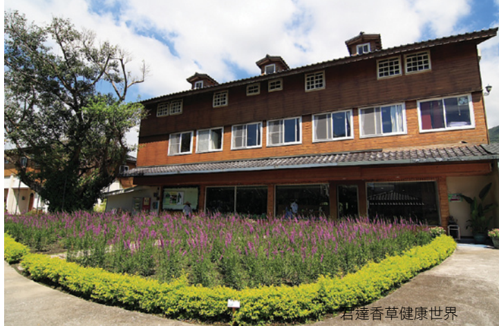
君達香草健康世界

The restaurant joined Hualien's organic agriculture association in 2005. It's a great joy to taste the