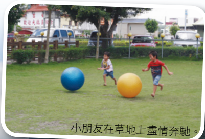
小朋友在草地上盡情奔馳。

Grass Century Health Plants Processing Factory employs the modern equipment to bake the hairy-nerved three-leaved Siberian Ginseng cultivated by the production-sale class of health plants into tea bags. The tea is very popular for its sweet and pleasant taste, as well as its health benefits.