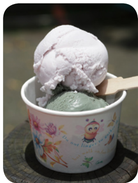
▲吉安鄉農會特製冰淇淋，香濃滑順，口口好滋味。

草世紀保健植物加工廠精製的刺五加茶包，以保健植物產銷班栽種的台灣原生種毛脈三葉刺五加，以現代化設備烘製而成，泡成茶飲，口感甘醇，是最佳養生極品，很受歡迎。