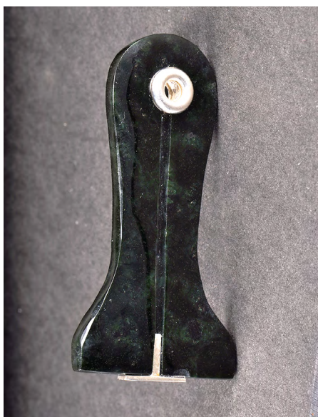
圖6 仿卑南玉器形制一別針