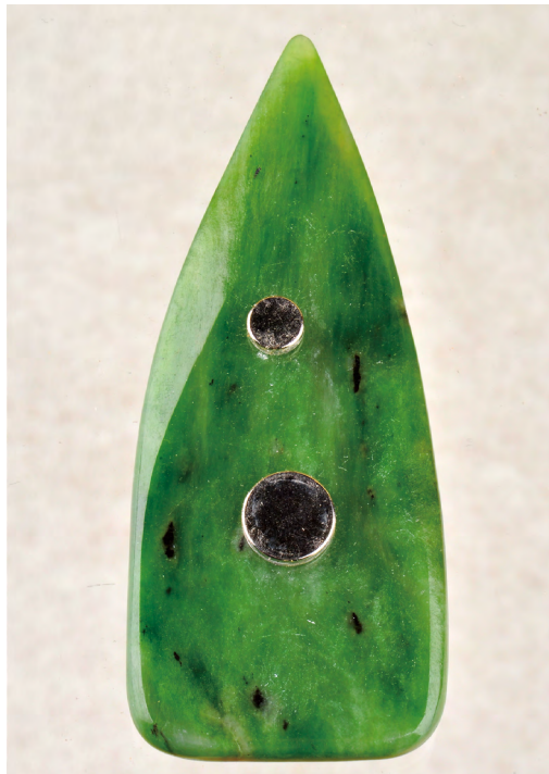
圖8 仿卑南玉器形制—別針