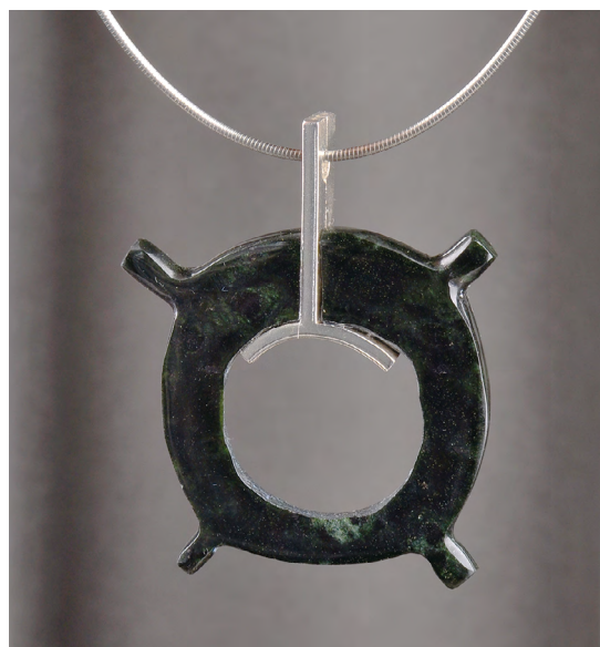
圖7 仿卑南玉器形制一墜飾