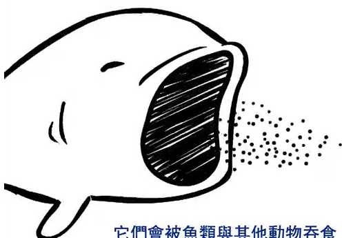
它們會被魚類與其他動物吞食

但恐怖的事不只一樣，這些塑膠微粒非常類似魚的食物，一旦流入海洋，凡是濾食型的海洋生物，通通都有誤食風險，如此一來，進入食物鏈循環：微粒→魚→遭捕獲→餐桌食物→人體，塑膠微粒汙染帶來雪球效應，將倍數放大。根據聯合國的估計，光是塑膠垃圾，每年給海洋生態系統造成的經濟損失就高達 130 億美元。