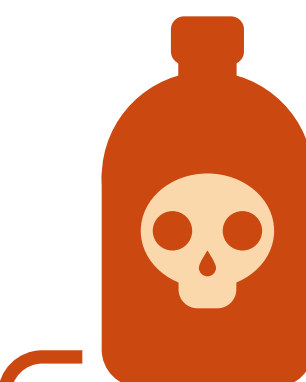
甲醛使用於 福馬林