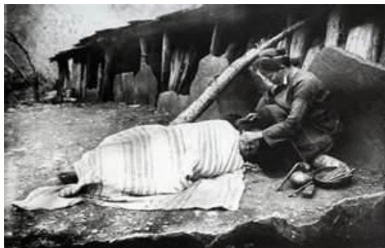
圖一、紋面過程(註四)

紋面的過程非常痛苦，將鋼針拍打入真皮內，切開皮肉表層，在傷口塗抹煙灰結痂而成(註三)(如下圖)。