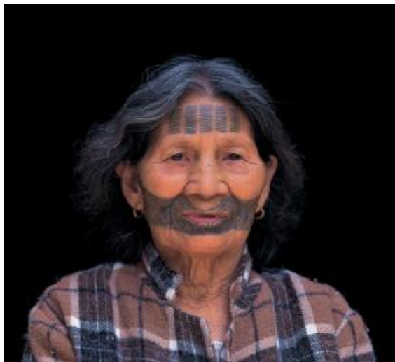
圖十六、賽德克亞族德奇塔雅群(註十二)