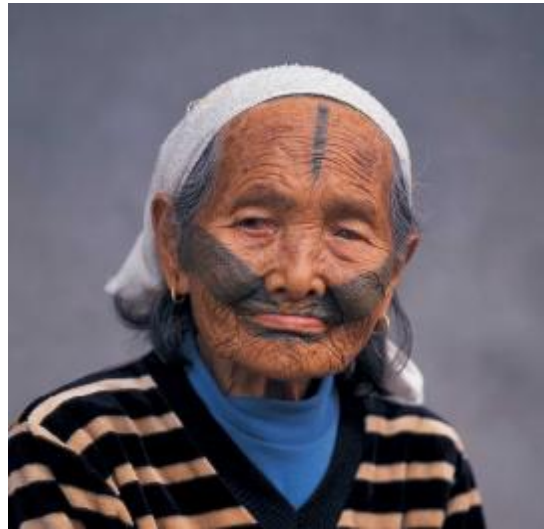
圖七、馬卡那奇系石加路群統(註七)