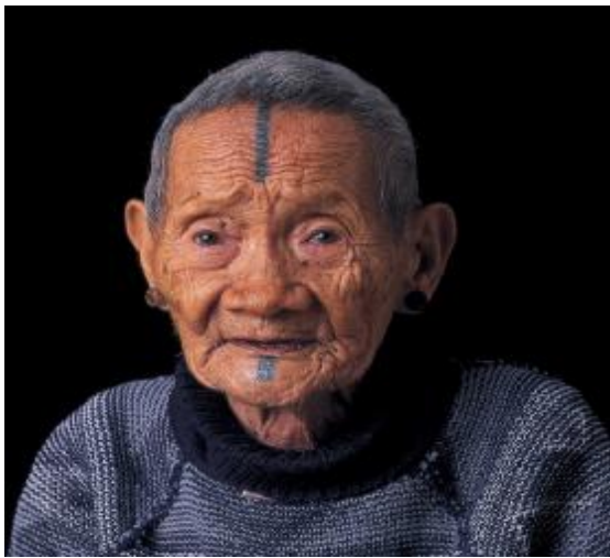
圖十二、馬立巴系統大料嶽群(註十)