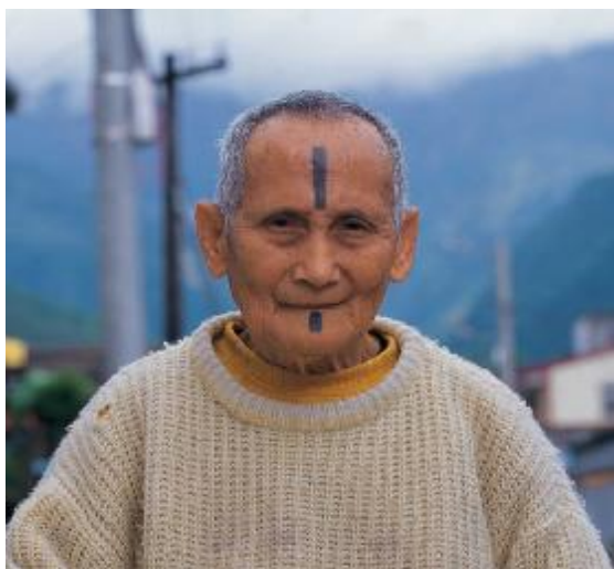
圖十九、太魯閣族(註十四)