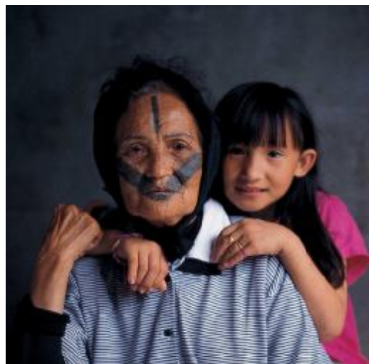
圖十五、馬立巴系統卡奧灣群(註十一)