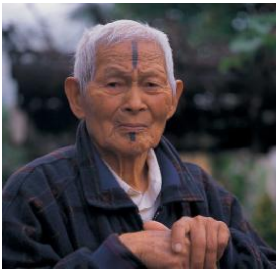
圖六、馬卡那奇系石加路群統(註七)