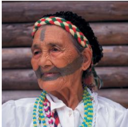
圖二十、太魯閣族(註十四)