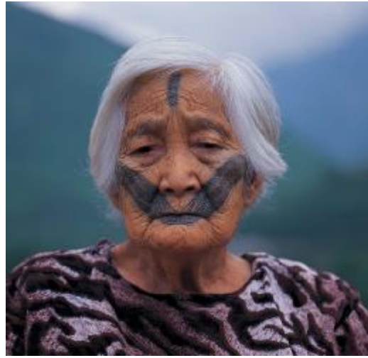
圖十一、馬卡那奇系統金那基群(註九)