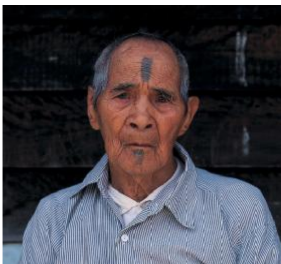
圖十七、賽德克亞族道澤群(註十三)