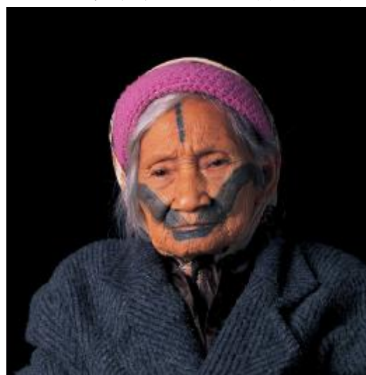
圖九、馬卡那奇系統大料嶽群(註八)