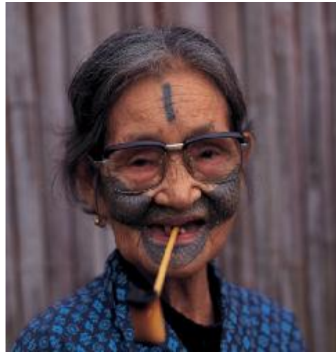
圖五、馬巴諾系統紋水群(註六)