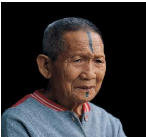
圖八、馬卡那奇系統大料嶽群(註八)