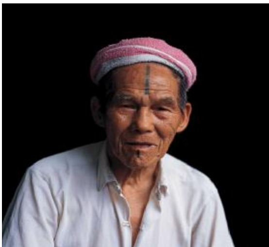
圖十四、馬立巴系統卡奧灣群(註十一)