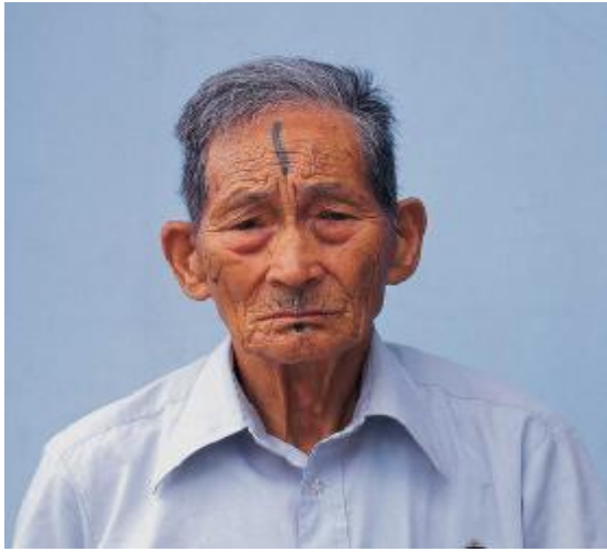
圖十、馬卡那奇系統金那基群(註九)