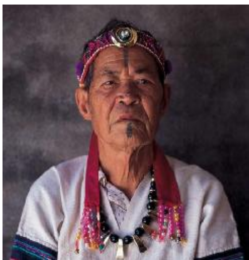
圖二、馬巴諾系統北勢群的紋面(註五)