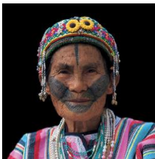
圖三、馬巴諾系統北勢群的紋面(註五)