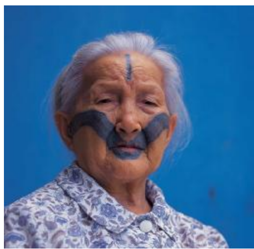
圖十三、馬立巴系統大料嶽群(註十)