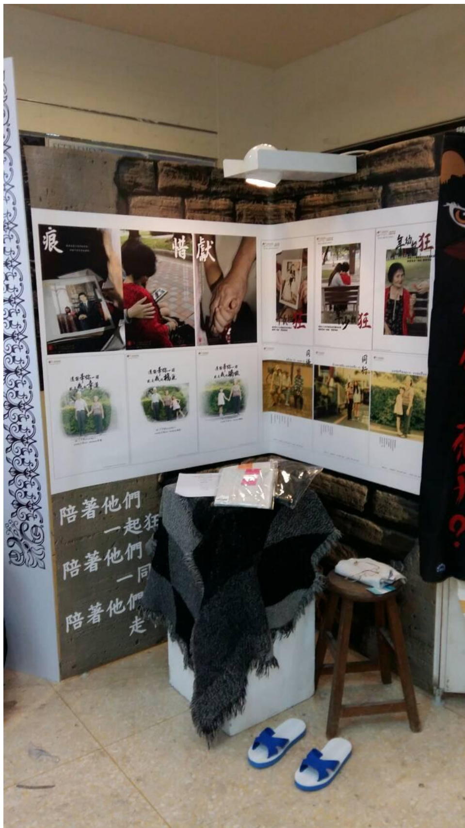
柒、校內外畢業展之展場照片：