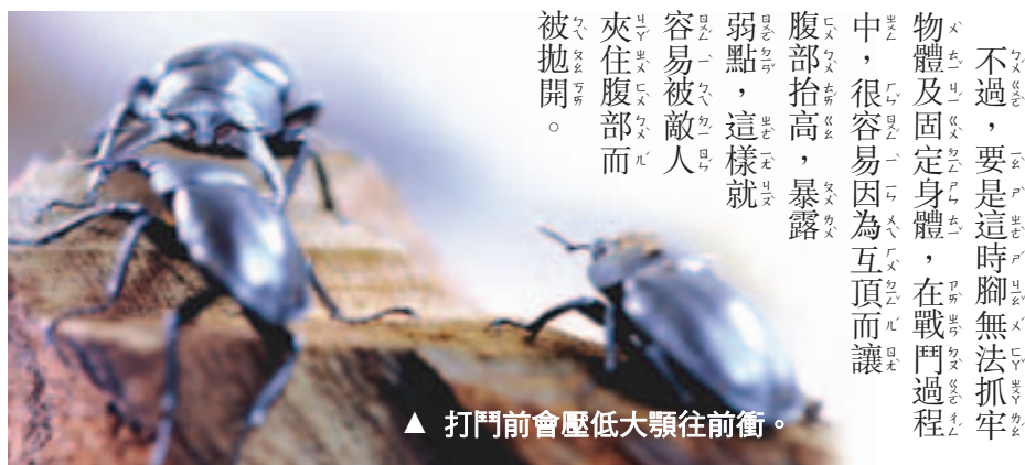
▲打鬥前會壓低大顎往前衝。

▶高砂鋸有三對腳，長在前胸、中胸與後胸，分別是前腳、中腳與後腳。 ▼腳在打鬥過程中，用於固定身體。